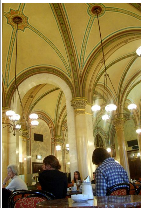
Et besøk på kafé eller konditori er obligatorisk når du er i Wien.

Wiens lengste shoppinggate er antakelig Mariahilferstraße. Her finner du en rik variasjon av butikker, ikke minst shoppingsenteret Gerngross , som er kjent for varer som gir verdi for pengene. Gerngross er på fem etasjer og har også restauranter dersom sulten melder seg. Adressen er Mariahilfer Straße 38–40. Du finner gaten i distrikt 6, sydvest for distrikt 1.