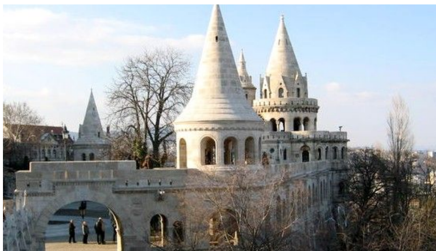
Budapest er Ungarns hovedstad og bare 2,5 timer fra Wien med leiebil.

Linz ligger nordøst i Østerrike og er bare to timer unna med bil, da ferden stort sett foregår på motorvei. Linz er kulturhovedstad i Europa i 2009 og har historie datert tilbake til romertiden. Få med deg byens katedral og festning og slapp av i byens Altstadt (historiske sentrum). Linz byr på mye kultur i tillegg til en litt annerledes atmosfære enn den du møter i Wien. Selve Linz har ca. 200 000 innbyggere.