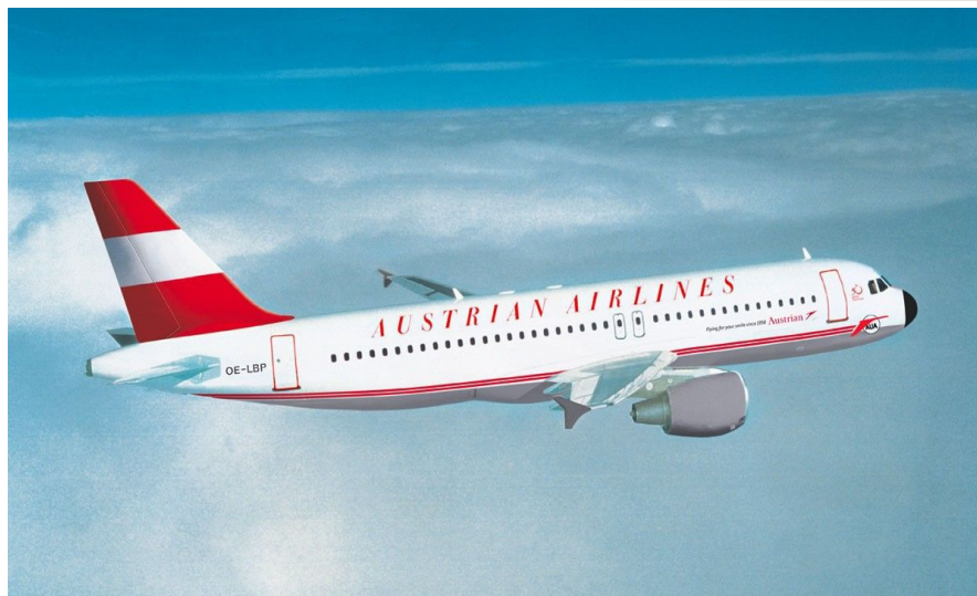
Austrian Airlines er ett av flyselskapene som tar deg til vakre Wien

En drosje fra flyplassen til Wien sentrum tar ca. 30 minutter. Du finner drosjene rett nord for ankomsthallen. Flytoget tar bare 16 minutter og koster ca. 75 kroner (9 euro). Det går også lokaltog. Her er prisen bare ca. 25 kroner. Reisen tar da i overkant av 30 minutter. Ønsker du å ta buss, så går det flybuss direkte inn til Wien.