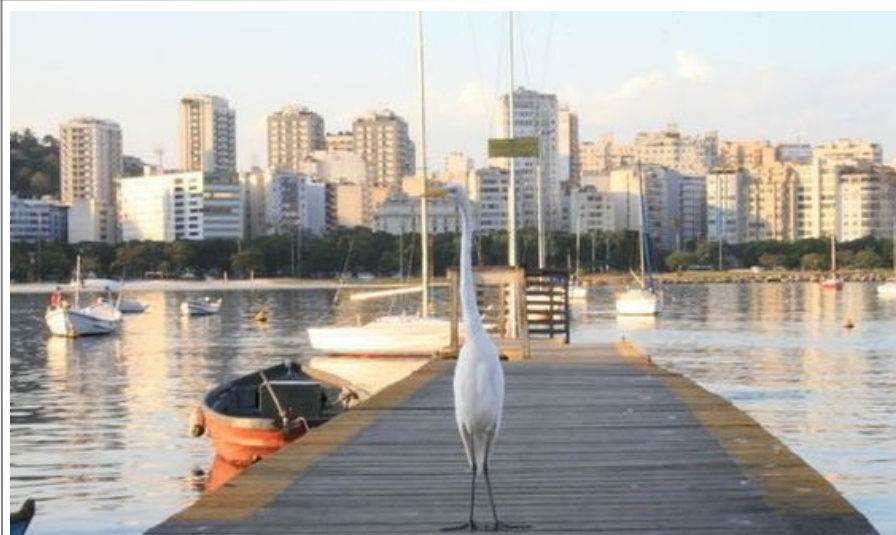
På Guanabara Club, like bak Botafogo midt i Rio, har du den beste utsikten mot både Jesusstatuen og Sukkertoppen, billig øl og fantastisk sjømat.

Rio de Janeiro Aeroporto Galeão ligger 21 kilometer nord for sentrum, og en taxi inn til sentrum koster vanligvis rundt 200 kroner. Du kan også ta minibuss. De går 1 – 2 ganger pr. time og bruker ca. 45 minutter. Prisen er rundt 20 kroner. Det er to bussruter. Den ene kjører inn til sentrum og videre til innenriksflyplassen Santos Dumont, og den andre kjører langs sørkysten, det vil si til Copacabana, Ipanema, Leblon og videre vestover.