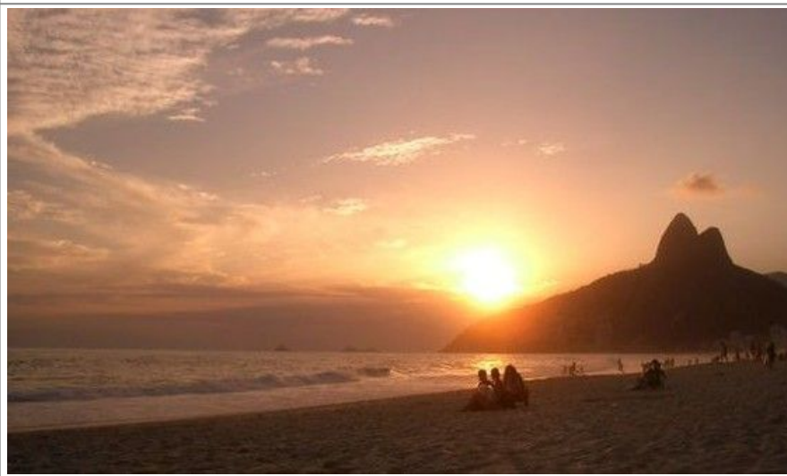
Bildet er tatt på Ipanemastranden, med fjellet Morro dois Irmaos (De To Brødre) i bakgrunnen

Denne lille fiskerlandsbyen i kolonistil har vært et yndet reisemål for de rike og sofistikerte siden Brigitte Bardot kom hit i 1960-årene. I dag finnes det over hundre overnattingstilbud, fra billige gjestehus til femstjerners resorts. Buzios ligger på en halvøy omgitt av ikke mindre enn 17 strender. Bussen fra Rio tar ca. fire timer, og du må bytte buss i Cabo Frio.