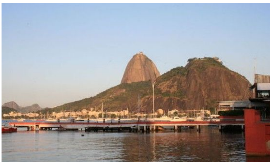
Pão de Açúcar, eller Sukkertoppen, er nesten 400 meter høy og gir deg strålende utsikt over hele byen. Her sett fra Clube de Regatas i Guanabarakbukten, midt i Rio.

Herfra kan du nyte utsikten over en av verdens vakreste byer. Du befinner deg nå 395 meter over havet. Her finner du restauranter, suvenirbutikker, utsiktsskikkerter og en koloni med søte, men usedvanlig frekke og tyvaktige apekatter, så hold på vesken. Det er ikke få turister som har kommet småflau fra Sukkertoppen til den lokale politistasjonen for å melde at "en apekatt stakk av med passet og Visa-kortet."