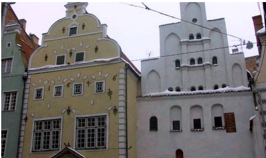
Disse tre spesielt godt bevarte husene kalles de tre brødre og ligger i gaten Maza Pils. Navnet på gaten betyr "de små slotts gate".

Gå nå gaten Maza Pils lela til du ser "De tre brødre". Dette er Rigas eldste steinhus. Fra de tre brødre kan du gå til gaten Torna lela (ta til høyre). Her finner du Svenskebuen. Les mer om Svenskebuen under attraksjoner. Fortsett videre langs den gamle og opprinnelige bymuren til du finner tårnet Pulvertornis på hjørnet av Torna og Smilsu lela. Dette tårnet er fra 1300-tallet. Se nøye på tårnets vegger, og du finner ni kanonkuler i muren fra den gang russerne angrep svenskene. Det var Sverige som regjerte i Riga på 1600-tallet.