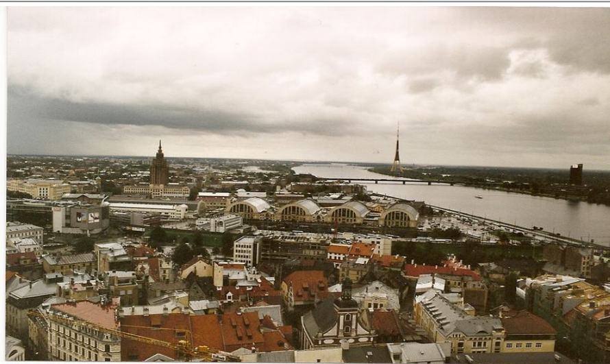
Riga sett fra Skyline bar på Reval Hotel Latvija

Av andre hoteller nevner vi Reval Hotell Latvija , som er et landemerke med sine 27 etasjer. Adressen er Elizabetes St. 55. Hotellet har bra med fasiliteter og er populært og moderne. Det har svært god beliggenhet. Det er bare 500 meter til operaen og gamlebyen. I øverste etasje ligger hotellets «Skyline bar» hvor du kan nyte et godt måltid eller en drink, samtidig som du får en fantastisk utsikt over Riga.