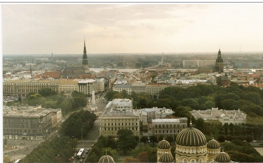
Utsikt over gamlebyen i Riga fra baren på Reval Hotel Latvija

Taxi kan stoppes på gaten. Prisen for taxi er ikke høy sammenlignet med i Norge, men pass på at taksometeret er på; hvis ikke kan du bli lurt. Unngå å bruke taxier som står utenfor de største internasjonale hotellene; disse er som regel dyrest.