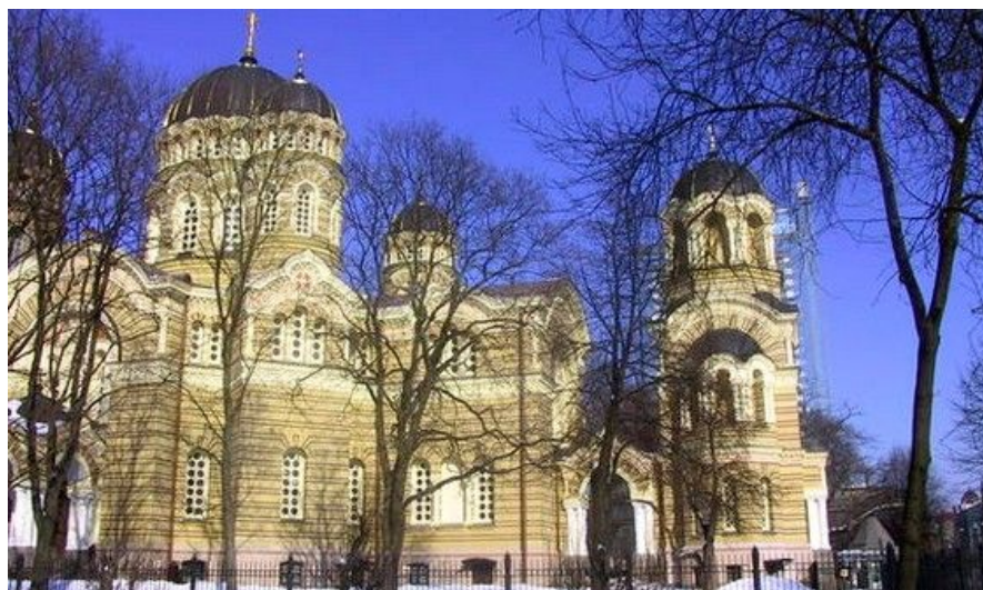
Riga sentrum har flere vakre kirker, denne befinner seg rett ved Frihetsmonumentet. Sentrum er så kompakt at det er som skapt for en hyggelig spasertur.

For deg med barn med på turen så kan et besøk på sirkus være en vellykket aktivitet. Dette er dessuten en aktivitet som kan være like mye en attraksjon for voksne. Sirkus er mer enn bare underholdning i Øst-Europa. Artistene er av verdensklasse, og sirkus har en lang og stolt tradisjon. Besøk Riga Sirkus, og la deg forundre av dyktige artister og veldresserte dyr. Du finner Riga sirkus på gaten Merkela Bulvaris 4.