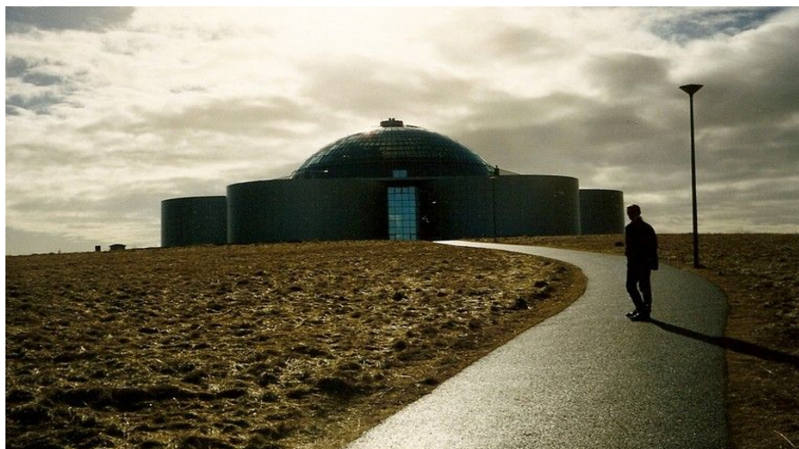
Perlan i Reykjavik er en kombinasjon av et varmtvannsreservoar, restaurant, museum og turistsenter.

Ønsker du å bo på et sted der du samtidig kan oppleve noe av Islands beste natur, er kanskje Hotel Glymur , 45 minutter utenfor sentrum, noe for deg. Dette er et luksuriøst butikkhotell beliggende høyt oppe i en fjellside med utsikt over Hvalfjorden, med restaurant, bar og geotermiske bad.