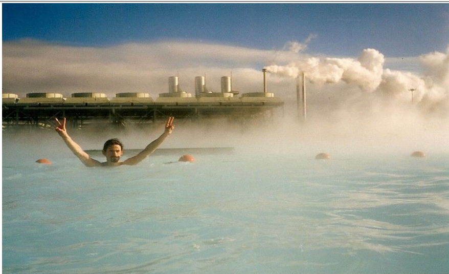
Den Blå Lagune. Vannet her er knallblått, og holder en jevn temperatur på rundt 35–40 varmegrader.

Vær litt varsom med å svømme ut mot midten av lagunen, for plutselig kan en skåldende het undervannsstrøm komme opp fra dypet og gjøre det direkte smertefullt.