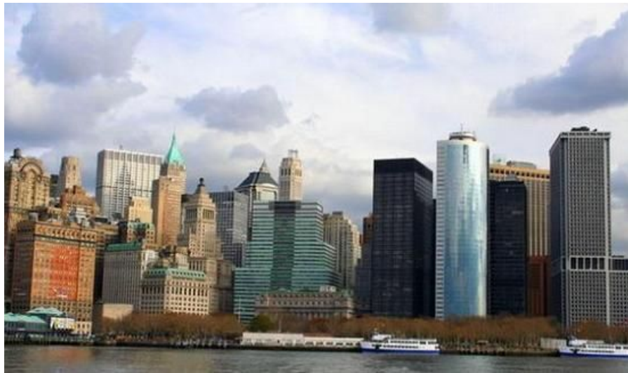
Storbyer som New York er faktisk ikke mye mer enn en 4 timers kjøretur unna Washington DC