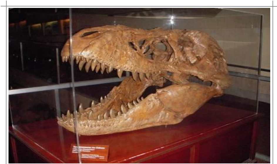
På byens enorme Naturhistoriske museum kan du blant annet se dinosaurer som denne.

Sett også av noen timer til National Zoo , hvor dere blant annet kan hilse på store pandabjørner, elefanter og løver, besøke fuglehuset, reptilsenteret og en kunstig tropisk regnskog. Også dyrehagen har gratis adgang, og er åpen fra 0600 alle dager. Den stenger 2000 på sommeren og 1800 i perioden november til mars. Adressen er 3001 Connecticut Avenue NW. Dere kan ta metroen til stasjonen Woodley Park-Zoo/Adams Morgan.