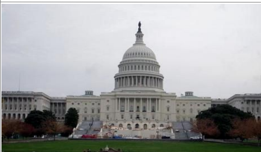
US Capitol Building er et av verdens fremste maktsentere

Ved foten av Capitol Hill ruver en enorm statue av den tidligere amerikanske presidenten og borgerkrigsgeneralen Ulysses S Grant til hest. Dette er verdens nest største rytterstatue, og står foran den idylliske Capitol Reflecting Pool, flankert av andre monumenter til minne om den amerikanske borgerkrigen (1861-65).