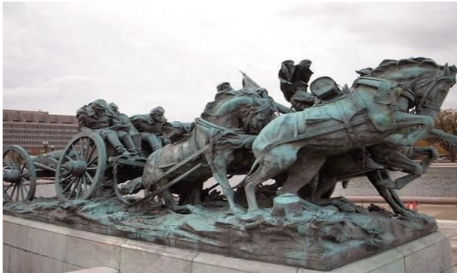
Ved foten av Capitol Hill står dette minnesmerket vedrørende den amerikanske borgerkrigen

Etter en sikkerhetskontroll møter du en statue av George Washington, som står ved heisdøren. Pussig nok fikk ikke kvinner lov til å bruke heisen tidligere, da det ble regnet som risikofyllt. Men de var velkomne til å ta trappene til topps i dette 169 meter høye monumentet som stod ferdig i 1884! På toppen har du en strålende utsikt over National Mall og Washington DC.