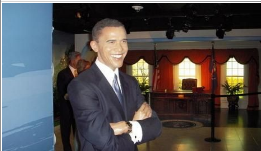
Allerede 5.november 2008, dagen etter valgseieren, var Barack Obama på plass i Madame Tussauds vokskabinett i Washington DC

Også i Washington DC finner du en avdeling av Madame Tussauds vokskabinetter. Her møter du stjerner fra film, sport og musikk, i tillegg til en del særamerikanske personligheter som presidentene og TV- og sportskjendiser som de fleste europeere knapt har hørt om. Vokskabinettet ligger på hjørnet av F Street og 10th Street, NW. Billettene koster 18 U$D for voksne og 15 U$D for barn inntil 12 år. Åpent fra 1000 alle dager, og stenger 1600 eller 1800, sjekk hjemmesiden for mer informasjon.