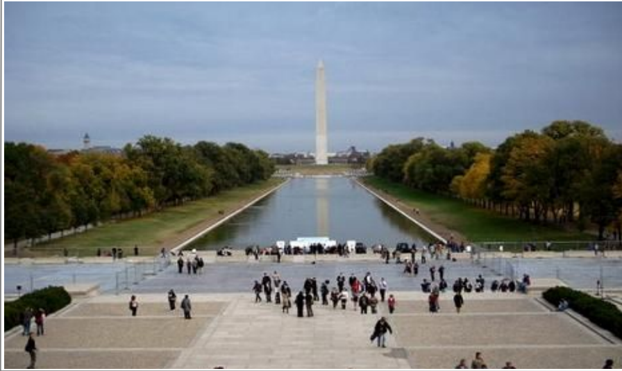
Fra Lincoln Memorial har du en nydelig utsikt over Reflecting Pool, Washington Monument og National Mall

Washington DCs multikulturelle natteliv. Langs Columbia Road og 18th Street vrir det av klubber og barer i alle varianter.