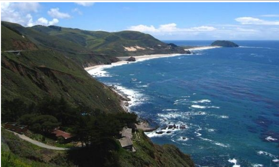
Big Sur, og Highway 1 er en populær strekning for turister å kjøre.

Du kan få en strålende vakker tur hvis du kjører Highway 1 langs kysten sørover. Monterey er en pittoresk liten by som var Californias hovedstad fra 1777 til 1849, men som i dag er mest kjent for sitt Monterey Bay Aquarium, et av de største i nord-Amerika. Dette er et av de beste stedene for å observere sjødyr, siden havområdet her er fredet. Det kan også anbefales å fortsette et par mil sørover til den nesten folketomme naturperlen Big Sur. Isolasjonen og idyllen her har i en årrekke tiltrukket seg kunstnere og forfattere som Jack Kerouac, Hunter S Thompson, Orson Welles, John Steinbeck og Henry Miller.