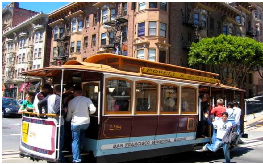
San Franciscos historiske gamle trikker, eller cable cars.

I løpet av besøket får du en 45-minutters audiopresentasjon, med fengselsbetjenter og tidligere fanger som faktisk har jobbet og sonet på Alcatraz. Regn med å bruke et par timer ute på øya, som også har et yrende fugleliv.