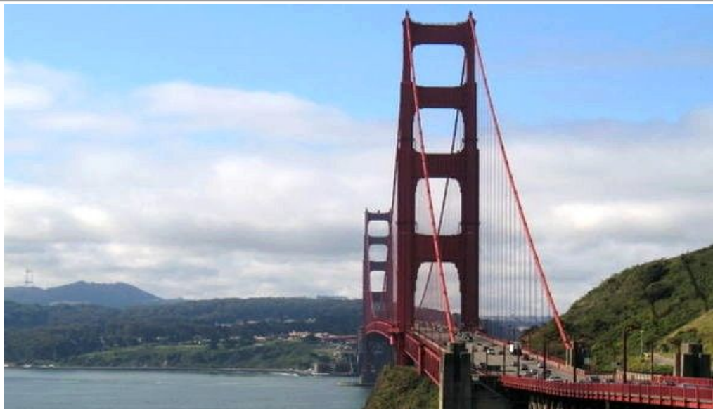
Golden Gate-broen fra 1937, som er verdens nest største hengebro.

Du bør merke deg at selv om San Francisco ligger i California, er klimaet atskillig kjøligere enn hos storebror Los Angeles, hvor det tilsynelatende alltid er sol og sommer. Turistbutikkens bestselger er varme gensere til besøkende som har feilberegnet byens temperatur.