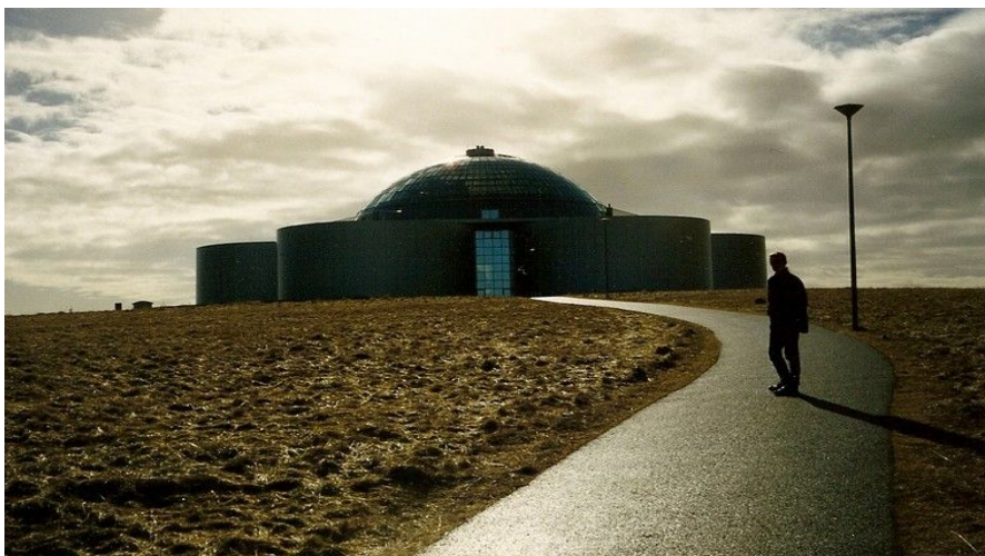
Perlan i Reykjavik er en kombinasjon av et varmtvannsreservoar, restaurant, museum og turistsenter.

Ønsker du å bo på et sted der du samtidig kan oppleve noe av Islands beste natur, er kanskje Hotel Glymur , 45 minutter utenfor sentrum, noe for deg. Dette er et luksuriøst butikshotell beliggende høyt oppe i en fjellside med utsikt over Hvalfjorden, med restaurant, bar og geotermiske bad.