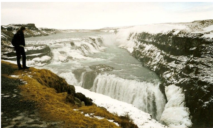
Islands mest berømte fossefall Gullfoss kaster seg dramatisk 32 meter ned i vannmassene under.

Bortgjemt i et månelandskapsaktig område sør for Keflavik flyplass finner du Islands mest besøkte og unike turistattraksjon. I den varme kilden Den Blå Lagune kan du hoppe ut i knallblått, rykende varmt vann selv om minusgradene biter deg i ansiktet. Lagunens mineralholdige vann har i en årrekke blitt brukt både til spa og til behandling av psoriasis. Åpent året rundt, fra kl. 0900 til 2100 på sommeren og fra kl. 1000 til 2000 fra oktober til mai. Inngang ca. 130 kroner for voksne, gratis for barn under 12 år.