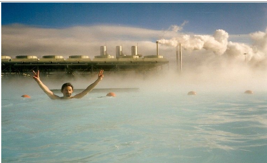
Den Blå Lagune. Vannet her er knallblått, og holder en jevn temperatur på rundt 35–40 varmegrader.

Vær litt varsom med å svømme ut mot midten av lagunen, for plutselig kan en skåldende het undervannsstrøm komme opp fra dypet og gjøre det direkte smertefullt.