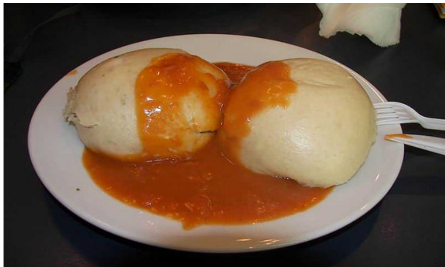
Polsk mat ser kjedeligere ut enn den er!

Husk dessuten at røykeloven (i skrivende stund) ikke helt har blitt innført i Polen. Det er vanlig med en røykeavdeling og en røykefri del i tradisjonelle restauranter. Si fra til hovmester eller kelner hva du foretrekker. På bar eller i nattklubben vil det ofte være lov å røyke.