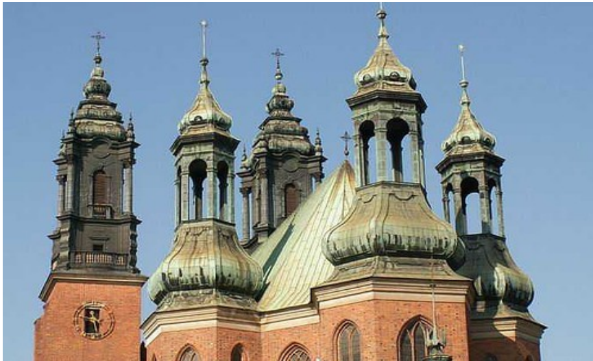
Poznańs flotte katedral er verdt et besøk!

Naturligvis vil du også legge merke til installasjonen ved rådhusklokken som forestiller noen kjempende geiter, (eller kanskje steinbukker?). Kampen foregår klokken 1200 hver dag og er en stor turistattraksjon! Adressen er Różany Targ/Stary Rynek.