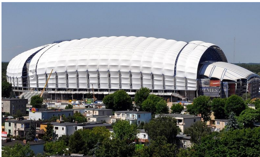
Den nye stadion i Poznan er klar for Europamesterskapet i fotball.

Alternativet er taxi som står i kø foran ankomsthallen. Det er ikke dyrt, men pass på at taksameteret står på og at det er en offisiell drosje du hopper inn i.