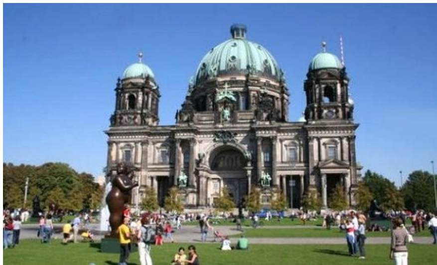
Det er mulig å kombinere Poznan med Berlin!.

Det finnes et utall av leiebilselskaper. Det er ikke nødvendigvis slik at du sparer penger på å leie bil hos lokale utleiery. I mange tilfeller er det like greit å bestille bil hjemmefra via internett.