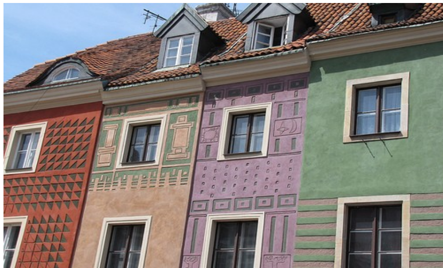
Gamlebyen i Poznan er verdt et besøk!

Poznan befinner seg ganske sentralt inne i Polen, men er nærmere vest enn øst. Det er faktisk mulig å ta en dagstur til f.eks. Berlin og Tyskland dersom det behovet skulle melde seg. I Tyskland er forøvrig Poznan kjent under navnet Posen.