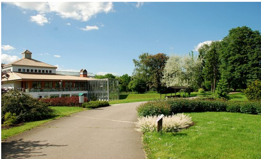
Det er mange grøntområder i Poznan. Her fra Botanisk hage.

Den nye dyrehagen finner du ved innsjøen Malta, øst for elven Warta. Adressen er Krancowa 81. Åpent hele uken, men kun 0900 til 1600 i perioden november til og med februar. Her er mange store dyr å skue, ikke minst er parken kjent for sine elefanter.