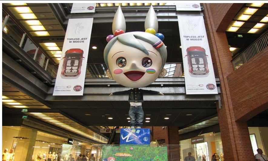
Noen av de flotteste shoppingsenterne i Europa finner du i Poznan.

Mange besøker også markedet på torget Bernardynski . Også dette rett i nærheten av Gamlebyen og dens store torg. Bernardynski-markedet har samme utvalg som Wielkopolski-markedet. Vil du på en liten oppdagelsestur tar du trikken (nr 5, 8, 14 eller 18) til Lazarski-markedet . Her handler lokalbefolkningen alt fra elektriske artikler og klær, til mat, grønnsaker og frukt. Besøk også Rynek Wildecki-markedet i bydelen Wilda, rett ved Sentralbanestasjonen.