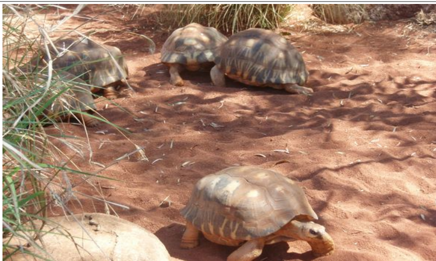
Skilpadder i Perth Zoo

Det finnes en del offentlige toaletter i Perth sentrum, men disse er av varierende kvalitet og vedlikehold, så vanligvis er det enklere og mer behagelig å stikke innom et hotell eller en restaurant når behovet melder seg.