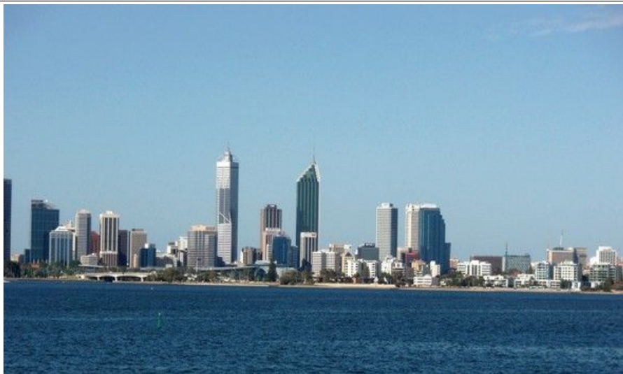
Perth Skyline er kanskje den mest imponerende i hele Australia

Innenfor stor-Perths grenser finner vi også Fremantle, en hyggelig havneby med 25 000 innbyggere. Det var faktisk her, 19 kilometer sør for Perth sentrum, at engelskmennene først ankret opp i 1829. Her finner du fortsatt mange kolonibygninger bygd av straffanger, blant annet The Round House. Dette er Vest-Australias eldste bygning og ble bygd som fengsel i 1830. Nordmenn kjenner kanskje navnet Fremantle som etappemål i verdens lengste kappseilas, Whitbread-seilasen.