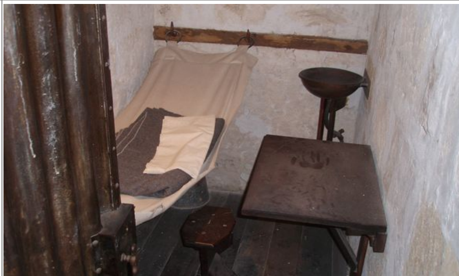
En gammel fengsels-celle i Old Fremantle Prison

Denne dyrehagen i det sørlige Perth har holdt åpent hver eneste dag siden den første gang åpnet i 1898 med to løver og en tiger.