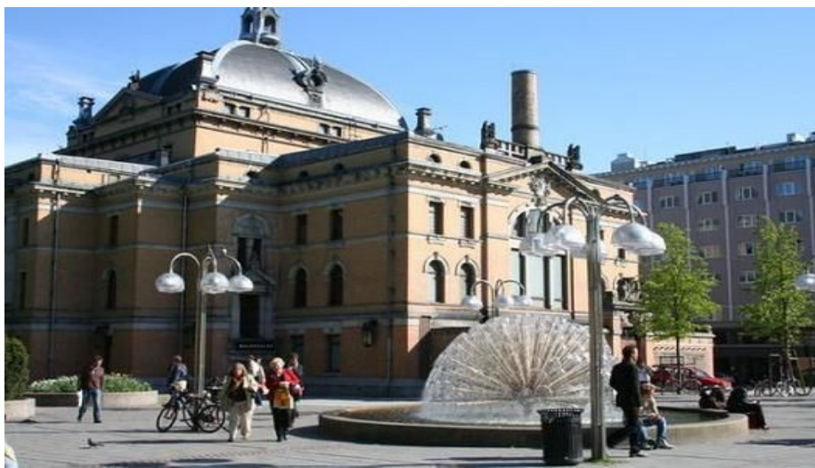
For mange er dette det første de ser av Oslo. Nationalteateret utenfor Nasjonalteateret stasjon hvor bl.a. flytoget stanser.

Et tredje alternativ er Rygge flyplass i Moss . Fra her kan du ta flybuss. Ryggeekspresen er tilpasset Norwegians ruter til og fra flyplassen.