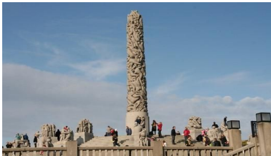
Den 17 meter høye monolitten i Vigelandsparken vekker alltid oppsikt og beundring

Leiligheten hvor Norges mest berømte forfatter, eller for den saks skyld landets mest berømte person, Henrik Ibsen. Ibsen bodde de siste 11 årene av sitt liv i dette huset. Her skrev han stykkene John Gabriel Borkmann og Naar Vi Døde Vågner. Guidede omvisninger hver hele time. Museet som åpnet i 2006 ligger i Henrik Ibsens gate 26, like ved slottet. Åpent tirsdag til søndag 11 til 18. Inngang 70 kroner for voksne og 25 for barn.