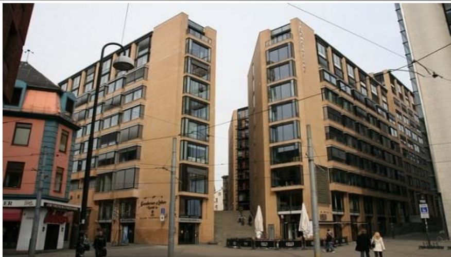
Hele Norges Hotell Cæsar er egentlig kontorlokaler, spisested og butikk.

Nå er sikkert tiden inne for en lunsj. Ved Tinghuset og Tullinløkka eller Kristian IV gate like ved, eller dennes parallellgate Karl Johan, finner du en rekke spisesteder.