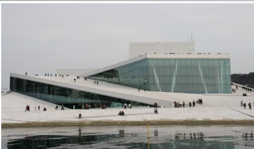
Oslos nye favorittsted for både turister og fastboende, Operahuset.

Billetter for en guidet omvisning fås på www.billett-service.no og koster 95 kroner for voksne og 65 kroner for barn/studenter/pensjonister.