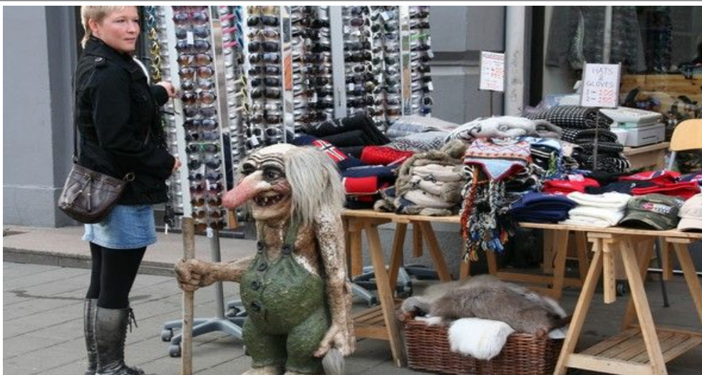
Strikkevarer, troll og de sedvanlige solbrillene er typiske suvenirer også i Oslo

De vanligste turistsuvenirene inkluderer små troll, strikkede gensere og lusekofter, og håndverkskunst med norrønt eller samisk design. Men dette er generelt svært dyrt. Hvis du finner en lusekofte til et par hundrelapper, er det garantert en maskinfabrikkert kopivare.