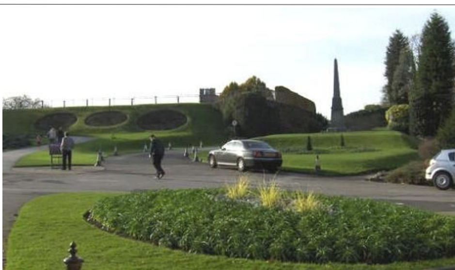
Utenfor Nottingham Castle er en flott park med statuer, obelisker og et museum

Du kan lett besøke Nottingham som en utflukt fra London. Toget fra St.Pancras-stasjonen, rett ved Kings Cross, i London til Nottingham tar ikke mer enn snau to timer, og prisen ligger på cirka 180 kroner hver vei. Eventuelt kan du få bussbilletter helt ned i ti kroner med National Express hvis du bestiller tidlig nok.