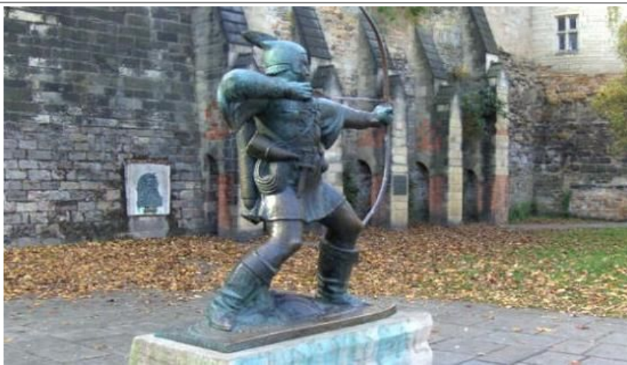
Robin Hood er overalt i Nottingham. Her på egen statue i Maid Marian Way

I skrivende stund er dette fortsatt under konstruksjon, men Nottingham Contemporary ligger an til å bli et stort moderne kunstgalleri, som også skal overta samlingene til det nå nedlagte Angel Row Gallery. Ifølge hjemmesiden forventes galleriet å åpne sine dører for publikum senvåren 2009.