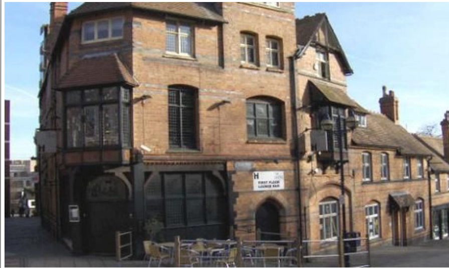
Castle Road nedenfor slottet er en av Nottinghams eldste gater

Her ligger også Nottinghams svært hjelpsomme og store turistinformasjon, og The Bell Inn, en av Englands eldste puber, fra 1276. De fleste av Nottinghams handlegater ligger rundt markedsplassen.