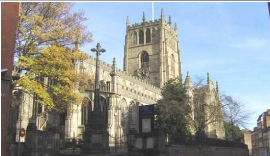
Bildet viser storslåtte St Mary Magdalena Church med aner fra 1300-tallet

Inngang fra Broadmarsh Shopping Centre, åpent alle dager fra 1030 til 1630. Inngangsbilletten koster cirka 60 kroner for voksne og 45 for barn. Vær oppmerksom på at du kan få reduserte pakkepriser hvis du besøker både Galleries of Justice og City of Caves.