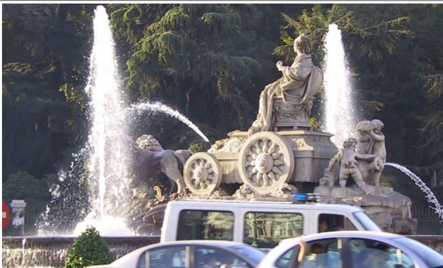
Plaza Cibiles er knutepunkt mellom avenyen Prado og Calle Acala, ikke langt fra Gran Via. Monumentet er et av Madrids mest kjente landemerker

I denne byen finner du et flott bygg fra midten av 1500-tallet. På veggene i palasset ser du verker av blant annet El Greco, Bosch og Titian. Biblioteket er blant verdens mest kjente med mer enn 50 000 forskjellige verker. Hvis du ikke har leiebil, kan du ta tog eller buss fra sentrum av Madrid (Puerto del Sol).