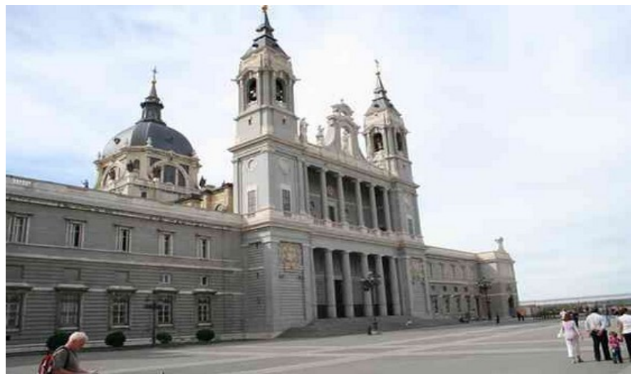
Katedralen Almunda som ligger like ved det kongelige slottet hadde først en gotisk stil, men er siden moderert i neoklassisk stil for å matche slottet.

Jordbærtoget er alle barns og voksnes favoritt. Toget er utkledd, og du får servert friske jordbær. Det går lørdager og søndager i perioden april til og med juli, i tillegg til september. Toget går fra Atocha-stasjonen kl. 1000 og returnerer fra Aranjuez kl. 1830. Togreisen inkluderer et besøk på slottet. Booking kan gjøres på Internet: www.renfe.es . På toget vil det være informasjon på engelsk.