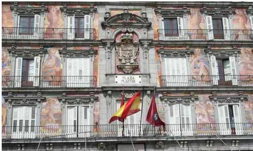
Plaza Mayor er plassen alle besøker og den er også en arkitektonisk perle som er perfekt bevart. Plaza Mayor er fra tidlig på 1600-tallet.

Kollektivtrafikk er rimelig i Spania og Madrid. Det samme er taxi. Taxi kan være et godt alternativ når du skal reise fra flyplassen. Veiene inn til Madrid er gode, og du betaler sjelden mer enn 150 kroner for turen.