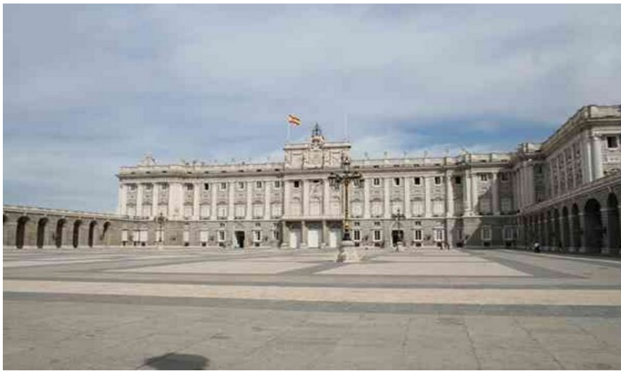
Det kongelige slott er en renessansebygning i typisk italiensk barokkstil.

Til middag vil du kanskje forsøke paella? Paella er en risrett som opprinnelig stammer fra Valencia. Det er egentlig en søndagsrett, men spises nå alle dager. Tilbehøret er grønnsaker og fisk, skalldyr eller kjøtt. La Paella de la Reina er en god og autentisk paellarestaurant. Den ligger i La Reina 39.