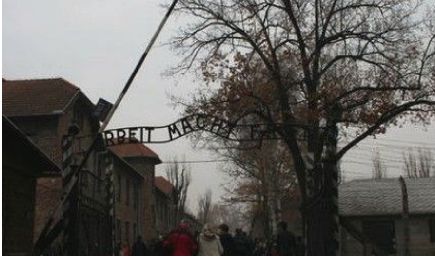
Auschwitz 1 med sitt Arbeit Macht Frei-skilt

Ved enden av Florianska kommer du til Florianporten, den eneste av portene i den opprinnelige bymuren som omkranset Gamlebyen som fortsatt eksisterer. Vis-à-vis ligger den imponerende Barbican, en steinfestning som skulle forsvare Florianporten fra den andre siden av vollgraven, som nå er gjort om til en park (Plantyparken). Etterpå er du sikkert klar for å slappe litt av på hotellet og/eller en pub en stund før det er på tide å tenke på kveldens middag.