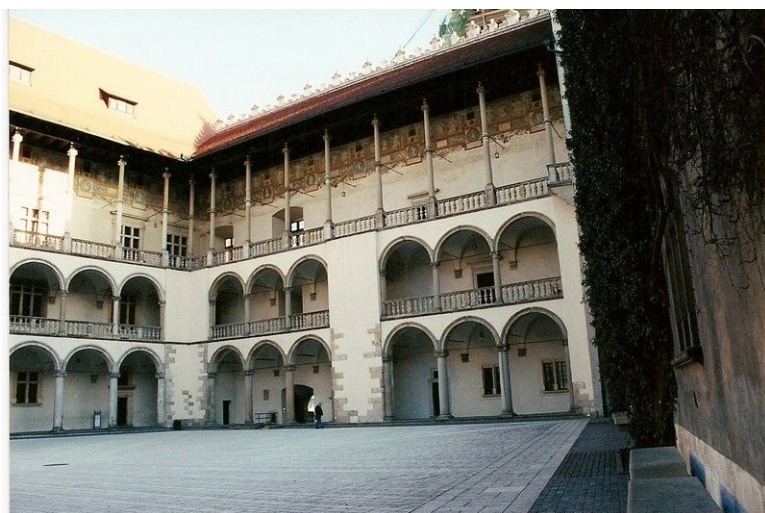
Bakgård i Wawel Slott

Golfspillere bør merke seg Krakow Valley Golf & Country Club, en 18-hulls bane som åpnet i 2003 og holder høy internasjonal standard. Banen ligger like utenfor Krakow og har eget hotell. Golf har ennå ikke blitt noen stor sport i Polen, og er forholdsvis dyrt etter polske forhold, så normalt sett er det ikke noe problem å få spilletid.