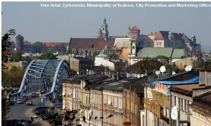
Utsikt over Krakow og Wawel Slott

Flyplassen er også kjent som John Paul II International Airport etter forrige pave, som studerte i Krakow, der han også var erkebiskop. På flyplassen finner du alt du trenger av informasjonskontor, bilutleie, minibank og vekslingskontor, stellerom, postkontor, spisesteder og butikker.