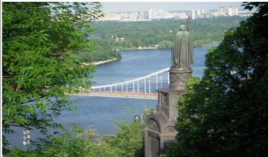
Kiev er en svært grønn og frodig by. Her finnes mange parker å besøke.