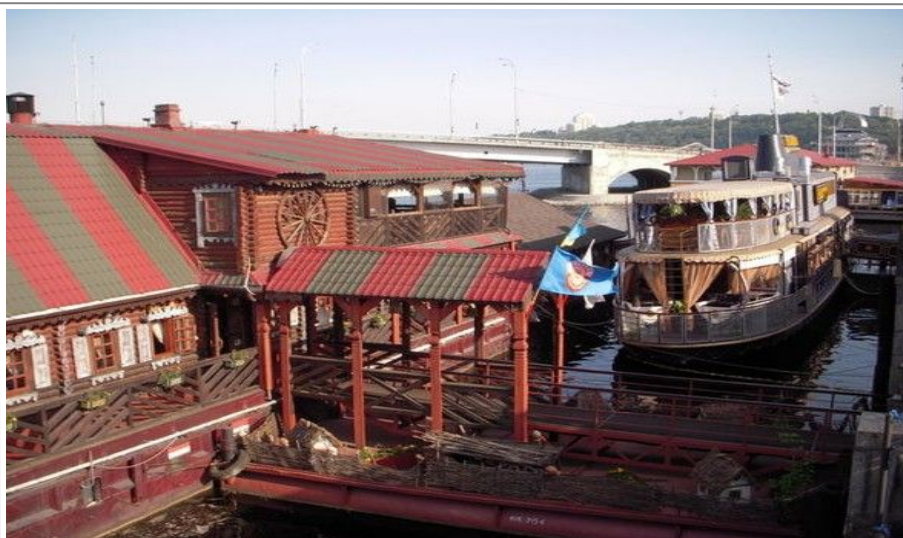
Den ukrainske båtrestauranten Khutorok ligger ved havnen i bydelen Podil, og er en populær restaurant i en populær bydel blant turistene.

I den sørlige enden av Khreschatyk ligger Metrograd (МЕТРОГРАД), og ikke langt unna finner du den 8-etasjes Mandarin Plaza (Мандарин-Плаза) med sine mange fasjonable klesbutikker. Her er også en lekeplass hvor du kan parkere barna mens du shopper.