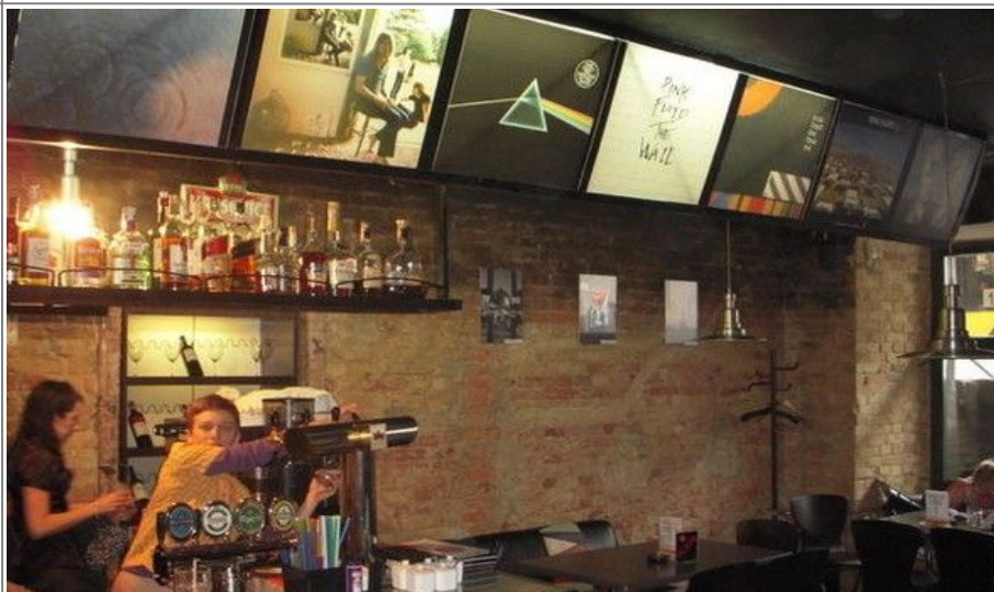
Er du ferdig med maten og vil ha en drink, så kan du jo besøke den ultimate Pink Floyd Puben, The Wall.

Drinkenavn som Comfortably Numb eller Brain Damage er en selvfølge. Men heldigvis har de ingen drink med navnet Several Species Of Small Furry Animals Gathered Together In A Cave And Grooving With A Pict. Åpent daglig fra 0800 til 2300. The Wall ligger i Velyka Zhotomyrska 25, like nord for Sophiakatedralen.