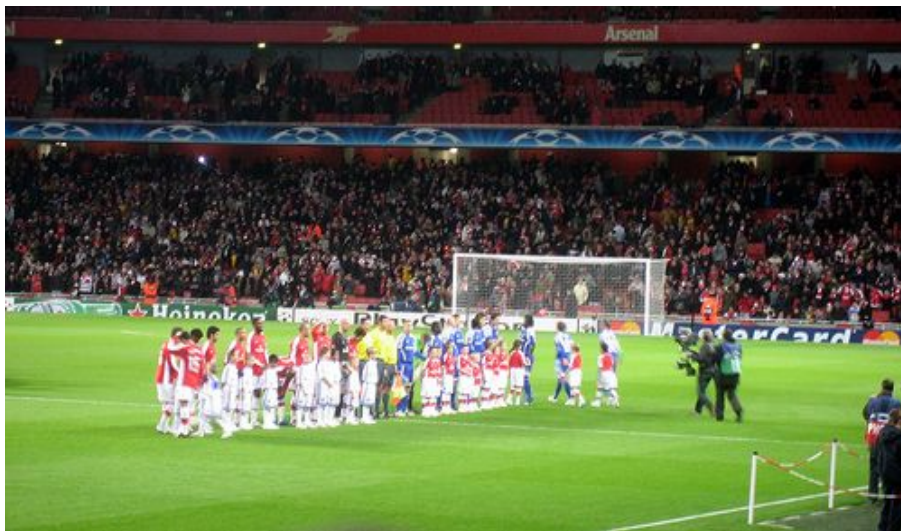
Her er Dynamo Kiev på besøk i London og Arsenal i en Champions League kamp.

Per 2009 har laget vunnet den ukrainske toppserien, som forøvrig ble opprettet i 1992, og den Ukrainske cupen samme antall ganger, henholdsvis 13 og 9 ganger. På det internasjonale plan har de to ganger vunnet den store europeiske Cupvinnercupen, i 1975 og 1986.