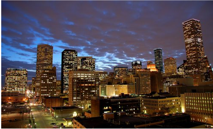
Skyline av Houston, downtown