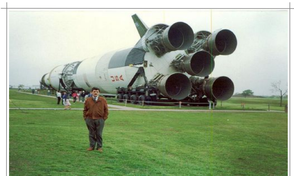
Den største turistmagneten i Houston er nok Houston Space Center.

(samtidsmuseum) - Bygningen som huser museet er en severdighet i seg selv. Arkitekten er den kjente Gunnar Birkerts og bygningen sto ferdig i 1972. Utstillingen byr på tankevekkende, spennende og morsom moderne kunst. Adressen er 5216 Montrose Boulevard.