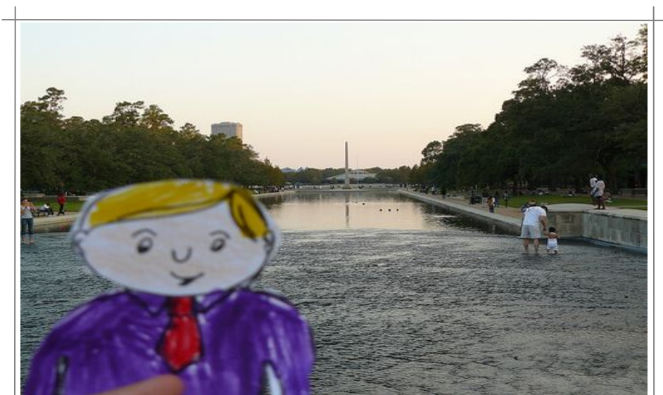
Alltid hyggelig å besøke Hermann Park. Og nok av aktiviteter for store og små.

Akvarier blir bare mer og mer populært, og akvariet i Houston sentrum med sine mer enn 200 dyresorter er noe å besøke for hele familien. Show holdes regelmessig. Her er også restauranter. Adressen er 410 Bagby Street.