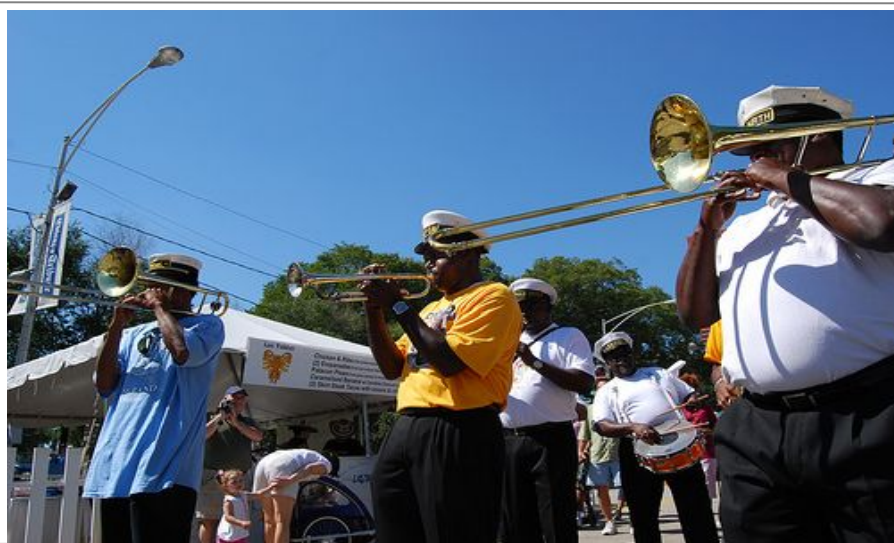
Du finner alltid musikk, festival eller opptog i New Orleans.

Sportsgale kan se frem til masse spennende på idrettsfronten. Byen huser nemlig en rekke stjerneklubber. Vi kan nevne Dallas Stars (NHL - Ishockey), Dallas Cowboys (NFL og Amerikansk fotball), Dallas Mavericks (NBA Basketball), Texas Rangers i Baseball og FC Dallas i Europeisk fotball.