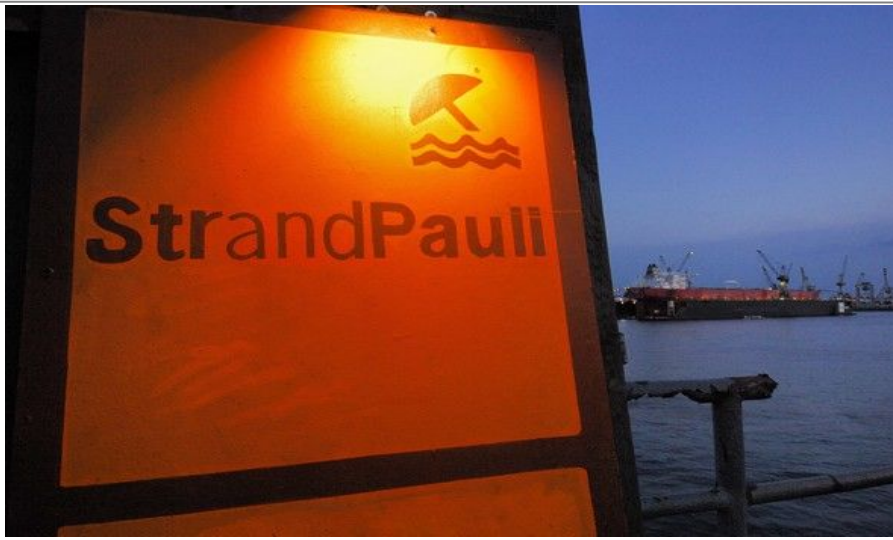
St. Pauli er arbeiderbydelen i Hamburg og byr på kneiper, red light district, en strand og hyggelige butikker

Området øst for stasjonen heter St.Georg , og her ligger mange rimelige hoteller, ølkneiper og barer.