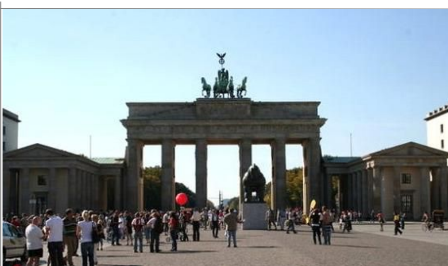
Berlin er en flott by og kan kombineres med Hamburg hvis du har leiebil

I Bremen brygges det verdensberømte Becks-ølet, og dette er hjembyen til et av Tysklands beste fotballag, Werder Bremen.