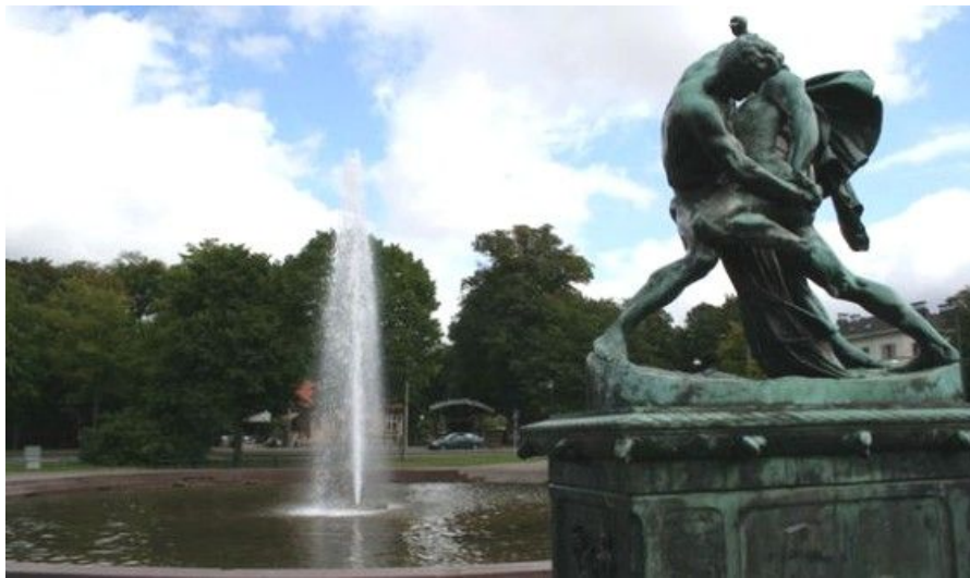
Trädgårdsforeningen er en stor park som ble anlagt i 1842 og ligger midt i sentrum, mellom Avenyn og Drottningtorget.

Liseberg har åpent fra april til oktober og holder dessuten åpent i desember. Inngang koster 60 kroner, men det er uten billetter til attraksjonene. Gratis adgang med Gøteborg Pass.