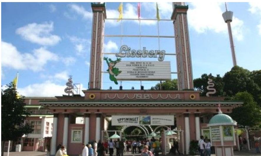
Gøteborgs fremste attraksjon for både fastboende og turister er utvilsomt Liseberg, Nordens største fornøylespark.

Etterpå er det ikke langt å spasere tilbake til sentrum, og har du lyst, stopper du på en av de mange pubene eller caféene du passerer på og rundt Avenyn.