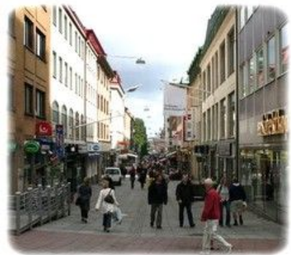
Kungsgatan er en populær shoppinggate i Gøteborg.

Du kan dessverre ikke få refundert den svenske momsen på 20 % ved utreise, med mindre du er statsborger i et land utenfor Norden og EU.