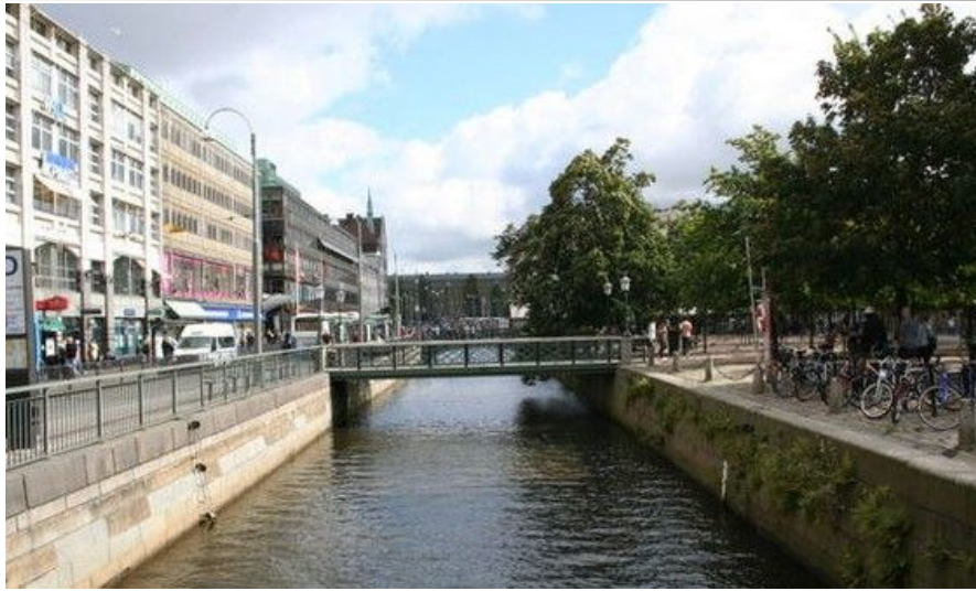
Ved Stora Hamnkanalen i sentrum ligger Brunnsparken, et populært møtested i Göteborg.

I enden av Östra Hamngatan ligger Kungsportplatsen, hvor du kommer til nok en kanal, Vallgraven. Krysser du broen, fortsetter paradegaten kungsportsavenyn rett frem. Du har nå Stora teatern og Kungsparken på din høyre side og den flotte parken Trädgårdsföreningen til venstre.