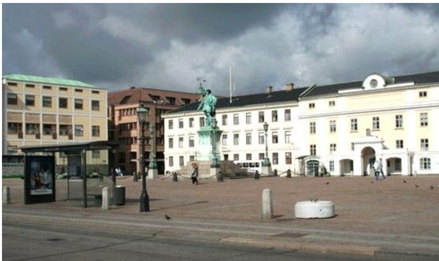
Gustav Adolfs Torg er Gøteborgs politiske sentrum, hvor byens grunnlegger står på sokkel, omkranset av Rådhuset, Børsen og Stadshuset

Gøteborg er Skandinavias største universitetsby, med over 60000 studenter, og dermed har byen også et svært livlig og variert uteliv. Her arrangeres også Skandinavias største filmfestival hvert år.