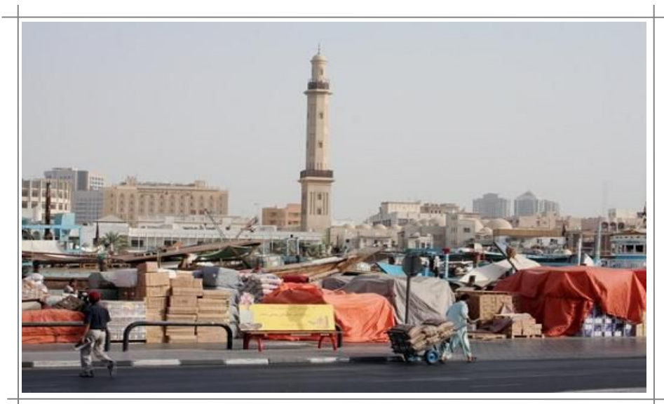
Grand Mosque i bakgrunnen sett fra havnen like ved gullsouken

I The Creek, ikke langt fra Bur Dubai, finner du Sheikh Saeed Al Maktoum House, en imponerende bygning fra 1896. Det var opprinnelig residensen til makthaverne. I dag er dette et museum.