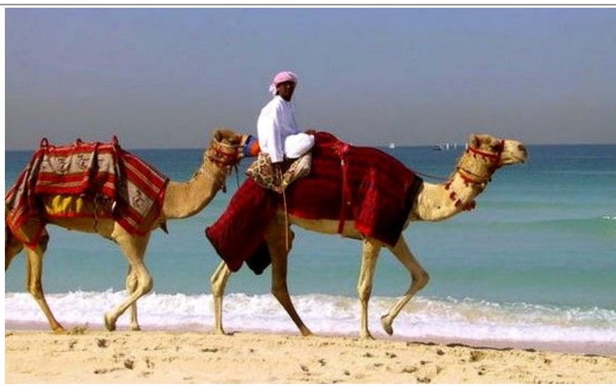
Strendene ved Dubai er flotte. Dette er ved Jumeirah Beach. Litt ekstra eksotisk blir det jo når kamelrytterne passerer forbi i rolig tempo.

Et alternativ kan være et middagscruise med en dhow på elven. Mange ser på dette cruiset som et høydepunkt på Dubai-besøket. Du får full arabisk buffé i tillegg til full bar. Det er levende arabisk musikk, og du kan slappe av og se på folkelivet på elvebredden. Et slikt cruise heter Al Mansour Dhow Dinner Cruise, og bestilling kan gjøres på tlf. 04 205 7333 eller ved informasjonsboden foran Hotell InterContinental i Deira.