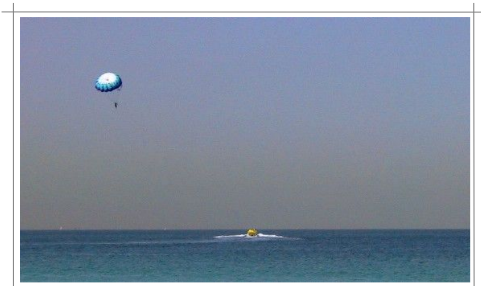
Vannsportaktiviteter er ypperlig i Dubai. Hotellet ordner ofte aktiviteter for deg.

I og med at Dubai ligger ved golfen, er det ikke overraskende at byen tilbyr en rekke aktiviteter for vannsport. Du kan leie jetski, vannski eller dykkerutstyr.