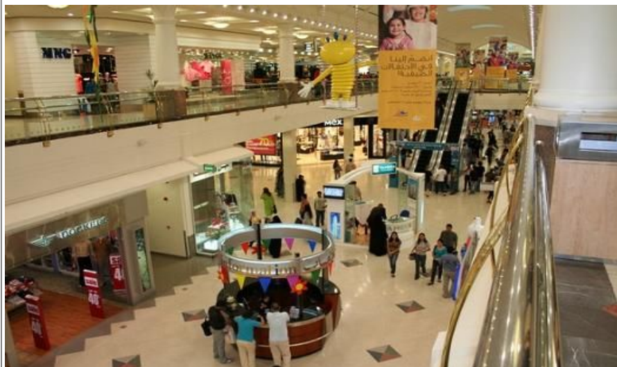
Shopping er folkesport i Dubai og det ene varemagasinet er mer fantastisk enn det andre

Den kanskje mest autentiske og best bevarte souken er kryddersouken . Den ligger like ved gullsouken. Gatene er trange, og her tilbys all verdens krydder. Duftene er spennende og eksotiske. Kryddersouken er en attraksjon som er vel verdt å oppleve. Forsøk også å besøke fiskesouken. Stå opp tidlig og se lokale fiskere by frem alle typer fisk, krabber og annet. Kanskje får du se en barracuda?