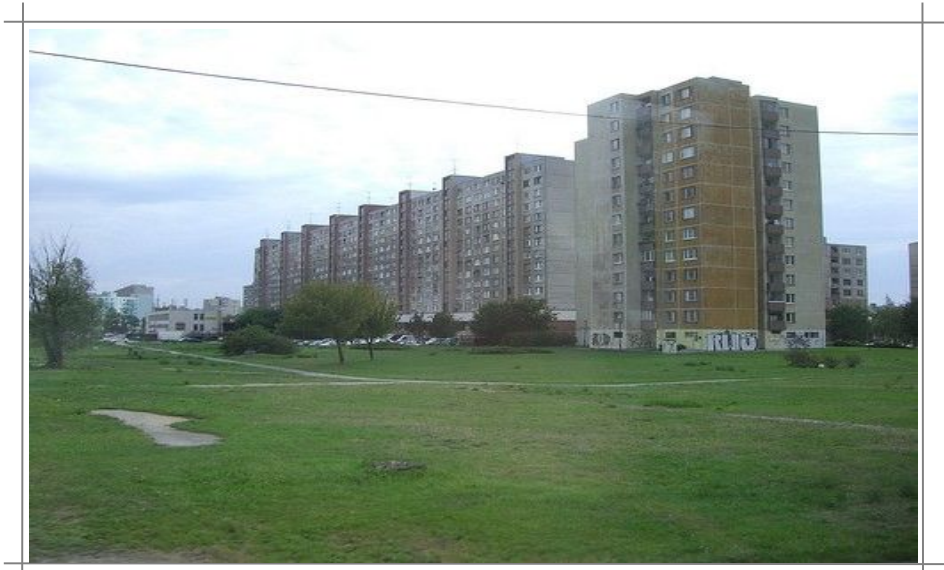
Petržalka byr på kommunistblokker.