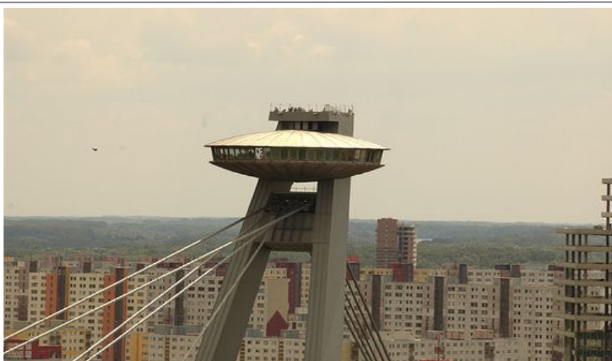
UFO-restauranten på toppen av nybroen må besøkes.

En av de mest anbefalte restaurantene for Pressburgermat, dvs. mat influert fra Østerrike og Ungarn, er Leberfinger som ligger på andre siden av Donau sett fra Gamlebyen. Kombiner restaurantbesøket med en flott spasertur! Adressen er Viedenská Cesta 257.