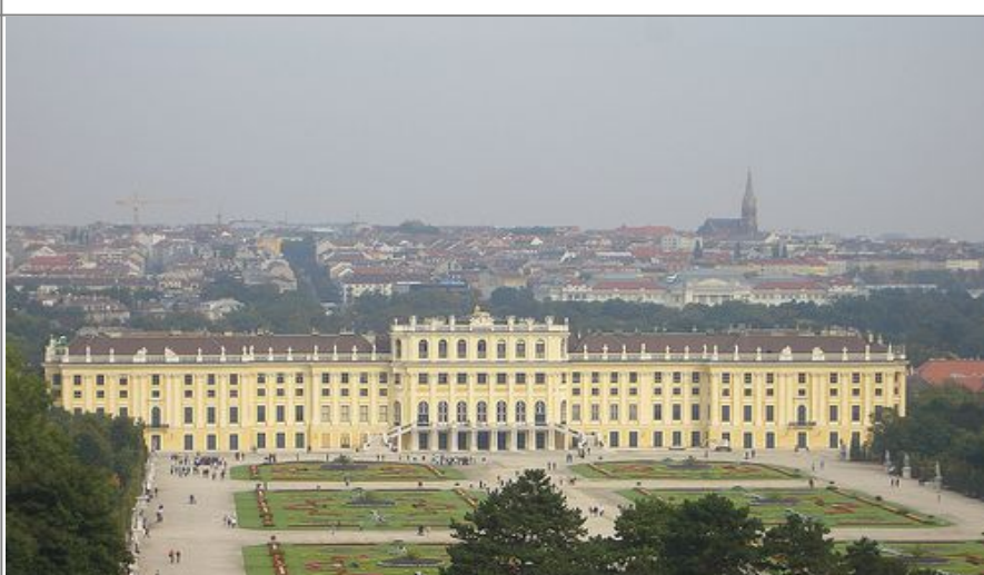
Wien må besøkes!

Historisk har Wien vært et samlingspunkt for mange nasjoner, ikke minst Romania, Ungarn, Serbia, Italia, Kroatia og Polen. Vi kan anbefale Wien til alle årstider, og byen passer like mye som weekendreisemål for familier som til romantiske turer for nyforelskede par.