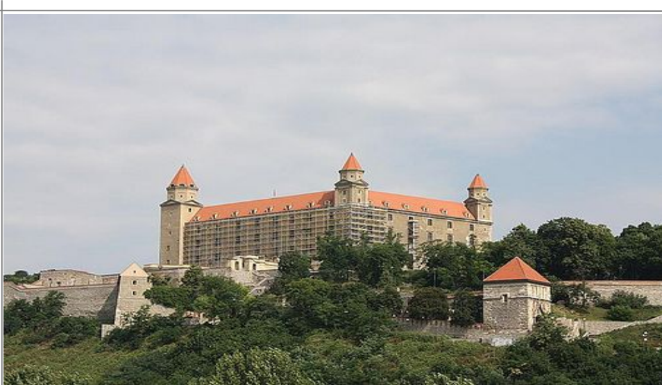
Bratislava slott er et av de største severdighetene i byen.

Alternativt velger du å fly med f.eks. Czeck Airlines, og via en mellomlanding i Tsjekkia ( Praha), flyr du hele veien til Bratislavas internasjonale flyplass.