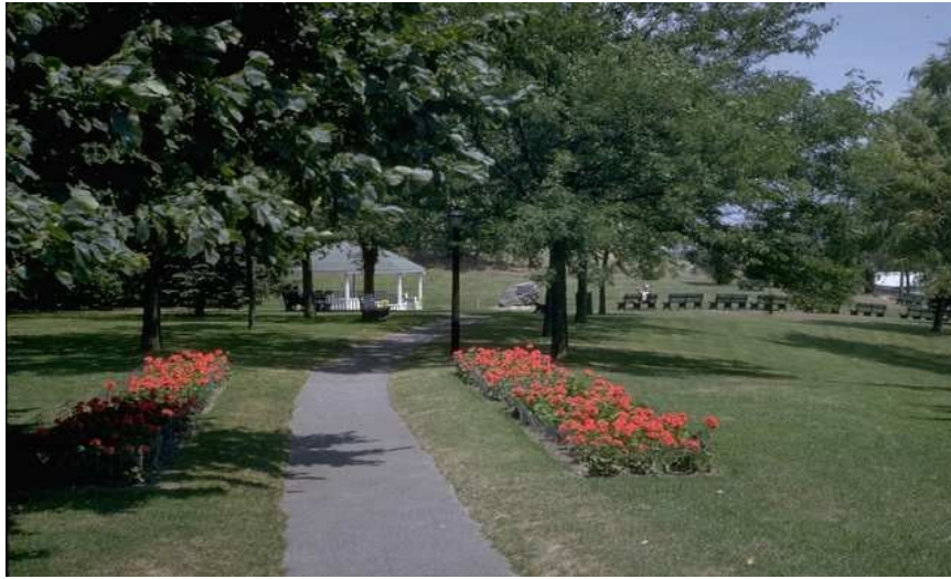
Boston Common er et herlig grøntområde hvor du kan slappe av og nye livet.

I samme gate, med det treffende navnet School Street, ligger Amerikas første offentlige latinerskole, som ble grunnlagt av puritanske kolonister i 1635. Her står en statue av en av skolens elever, Benjamin Franklin. Hans barndomshjem ligger forøvrig bare ett kvartal unna, på Milk Street.