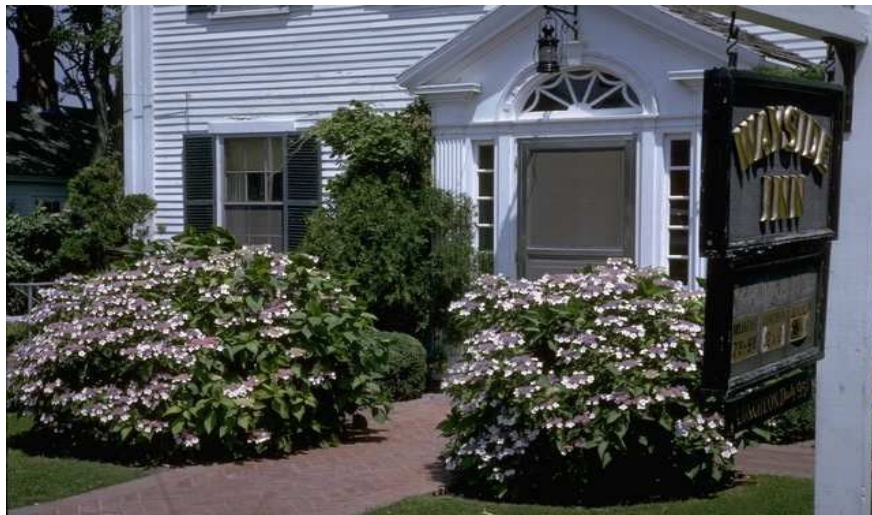
Route 20 i Sudbury rett utenfor Boston by er et yndet utfluktsmål, blant annet for mat og drikke i landlige omgivelser.

I dag har Salem rundt 41000 innbyggere, og turistorganisasjonene melker oppmerksomheten rundt hekseprosessene for alt det er verdt, med flere heksemuséer med gjenskaping av en rettsak og omvisning i fangehullene. Her finner du også et piratmuseum. Men selv om Salems historie er dystert er kystbyen både hyggelig og fargerik.