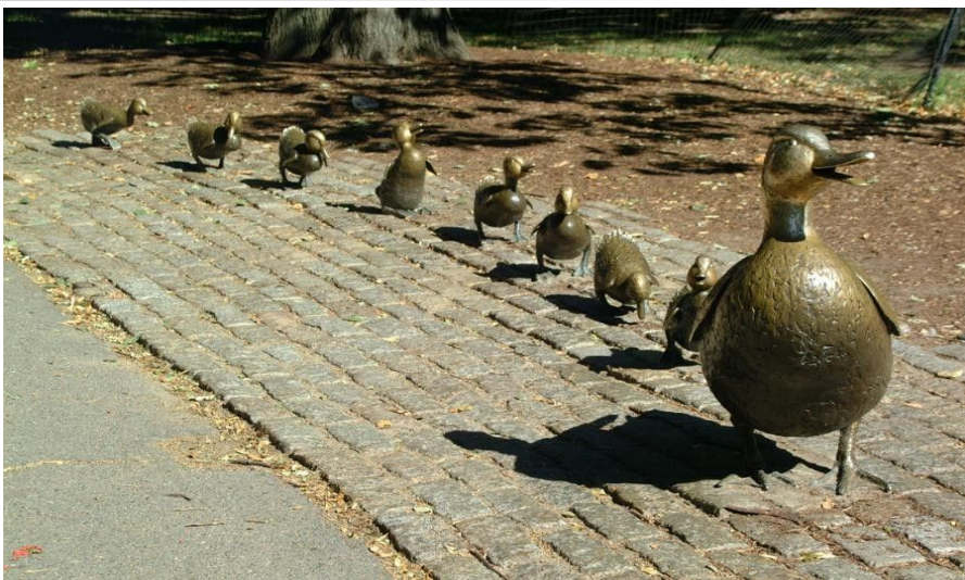
I Public Garden finner du en av Bostons mest yndede fotoobjekter, en andemor med sine unger.

Det er også obligatorisk med et besøk på Childrens Museum på Childrens Wharf, 300 Congress Street. Her er det mange interaktive utstillinger beregnet på å hjelpe barna til å forstå vitenskap, kunst, kultur og miljøspørsmål på en morsom og inspirerende måte. Åpent 1000 til 1700 alle dager, fredager helt til 2100. Inngang rundt 60 kroner for voksne og 45 kroner for barn.