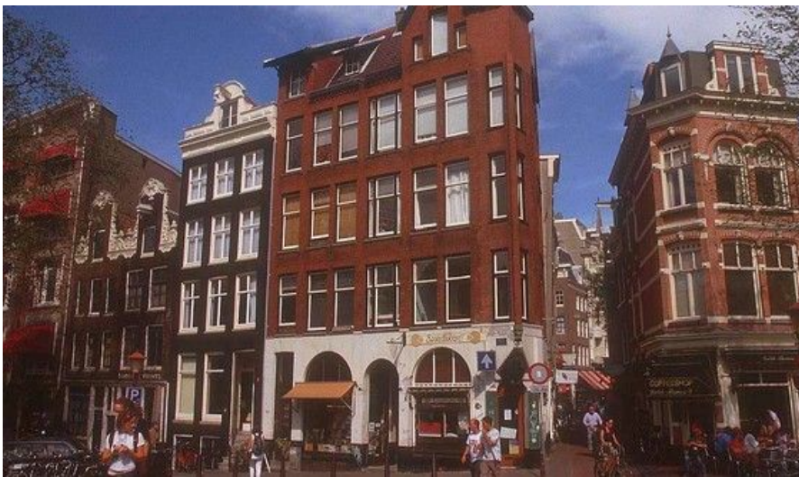
Dette er ekte Amsterdam. Coffee-shops ved kanalbredden, trange gater og smale underfundige bygårder i alle farger og størrelser.

Hotellet har 71 rom, er familiedrevet og holder til i en bygning fra 1600-tallet. Det ligger sentralt i Amsterdam, vis å vis den kjente kanalen Singel. Prisen er fra ca. 700 kroner pr. natt pr. person i dobbeltrom. Adressen er Singel 303–309.