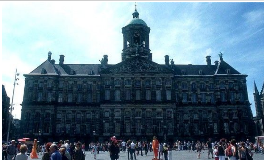
Koninklijk Paleis er en av de vakreste bygningene i Amsterdam og ligger rett ved Damplassen.