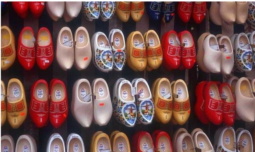
Her i Nederland er tresko en institusjon i seg selv. Og de er lett synlige.

Butikken Shakedown i sentrum av Amsterdam har i nærmere 100 år vært leverandør av mote for vanlig bruk. Du finner butikken i Nieuwendijk 107 (ca. 400 meter fra sentralbanestasjonen), og her kan du kjøpe innovative t-skjorter, bager og undertøy. Du kan også få kjøpt spesiallagde produkter bare for deg. Ventetiden er ca. 30 minutter.