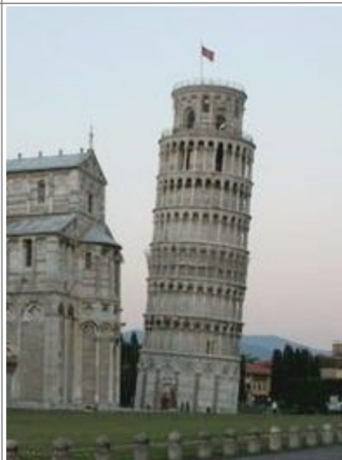
Det Skjeve Tårn på Campo dei Miracoli.

Pisa har ikke spesielt mange eller velholdte offentlige toaletter, så hvis en krise skulle oppstå, er det oftest enklest å stikke innom nærmeste hotell eller restaurant og spørre om lov til å benytte deres fasiliteter.