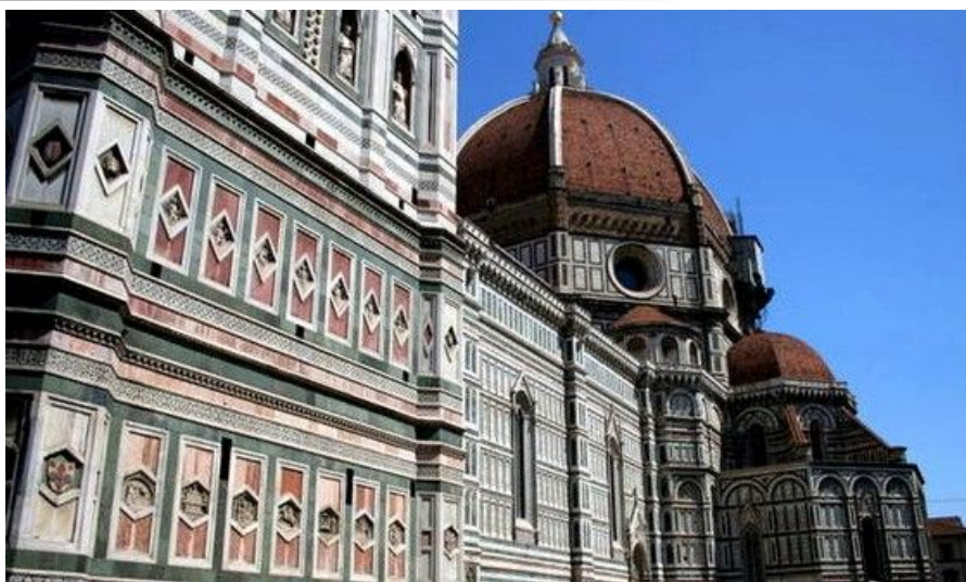
Firenze er visstnok den byen i verden med mest kunst per kvadratmeter. Legg merke til detaljrikdommen til byens kirker og katedraler.

Her står Michelangelos David-statue, og her finner du den berømte broen Ponte Vecchio. Har du ikke bil tilgjengelig, går det tog mellom Bologna og Firenze rundt hvert tjuende minutt, disse tar en snau time hver vei.