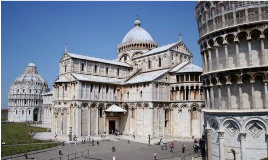
Dette flotte bildet viser oss utsikten mot Campo dei Miracoli, med Battistero, Katedralen og Tårnet, sett fra hagen i Operamuséet.

Vi skal ta for oss hele området nærmere i morgen, men hvis du ikke har forhåndsbestilt billetter til Tårnet på nettet, kan det være lurt å stikke innom billettkontoret i den gule bygningen rett bak Tårnet.