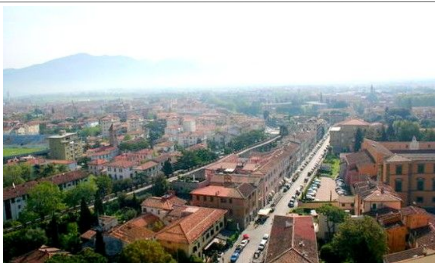
Utsikten mot Pisas nordlige deler fra toppen av Det Skjeve Tårn.

Pisa er ikke en spesielt grønn by. Det er mange torg og markeds plasser, men nordøst for Borgo Stretto ligger en hyggelig og avslappende park ved siden av kirken Santa Catarina. Her samler studenter fra universitetet seg, og det er et trivelig sted å sette seg ned med en medbragt lunsj.