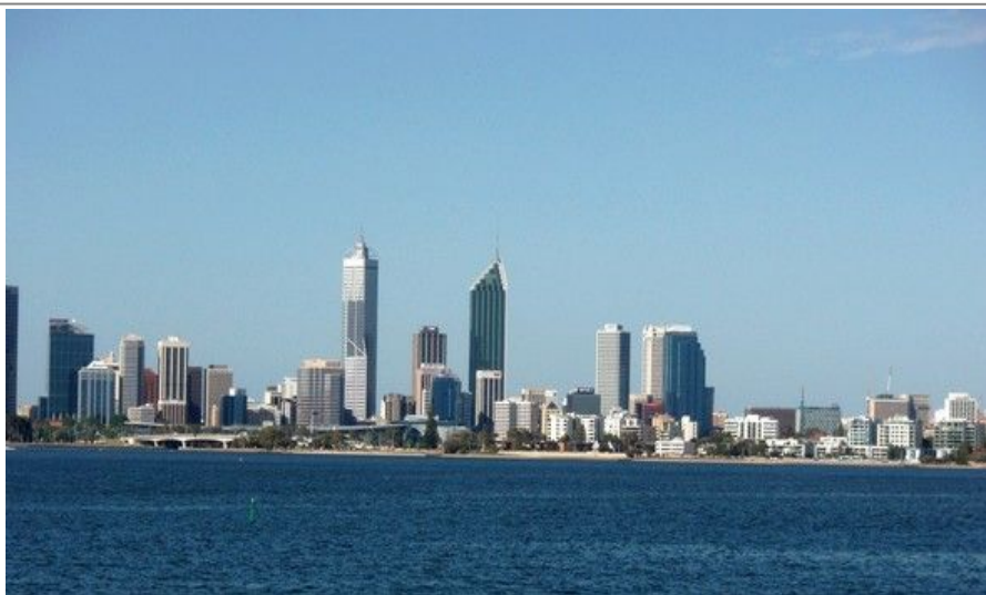
Perth Skyline er kanskje den mest imponerende i hele Australia

Innenfor stor-Perths grenser finner vi også Fremantle, en hyggelig havneby med 25 000 innbyggere. Det var faktisk her, 19 kilometer sør for Perth sentrum, at engelskmennene først ankret opp i 1829. Her finner du fortsatt mange kolonibygninger bygd av straffanger, blant annet The Round House. Dette er Vest-Australias eldste bygning og ble bygd som fengsel i 1830. Nordmenn kjenner kanskje navnet Fremantle som etappemål i verdens lengste kappseilas, Whitbread-seilasen.