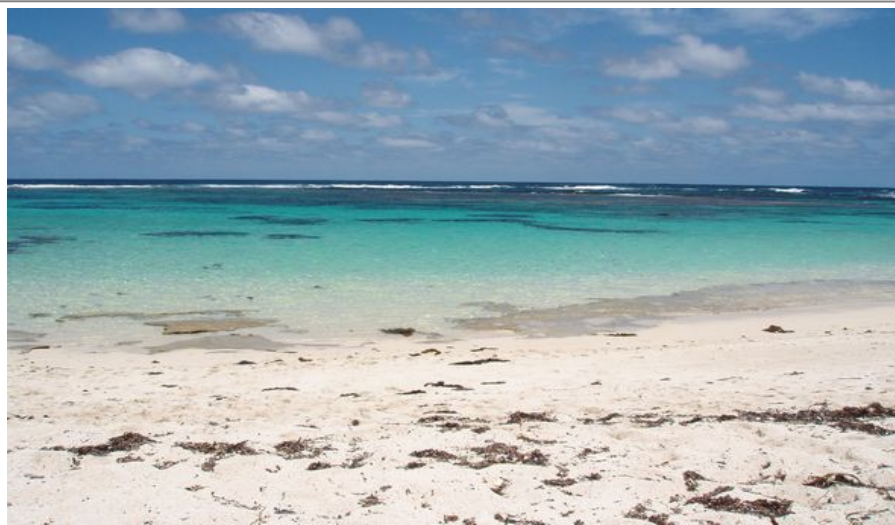
Rottnest Island har i mer enn 50 år vært perth-innbyggenes utflyktssted.

Her er det nok av strandrestauranter og spisesteder der du kan få deg en god og rimelig lunsj mens du har utsikt mot Det indiske hav. Etterpå frister sikkert bølgene eller sandstranden i noen timer.