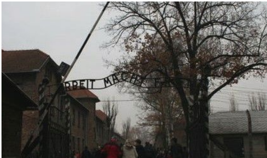
Auschwitz 1 med sitt Arbeit Macht Frei-skilt

Ved enden av Florianska kommer du til Florianporten, den eneste av portene i den opprinnelige bymuren som omkranset Gamlebyen som fortsatt eksisterer. Vis-à-vis ligger den imponerende Barbican, en steinfestning som skulle forsvare Florianporten fra den andre siden av vollgraven, som nå er gjort om til en park (Plantyparken). Etterpå er du sikkert klar for å slappe litt av på hotellet og/eller en pub en stund før det er på tide å tenke på kveldens middag.