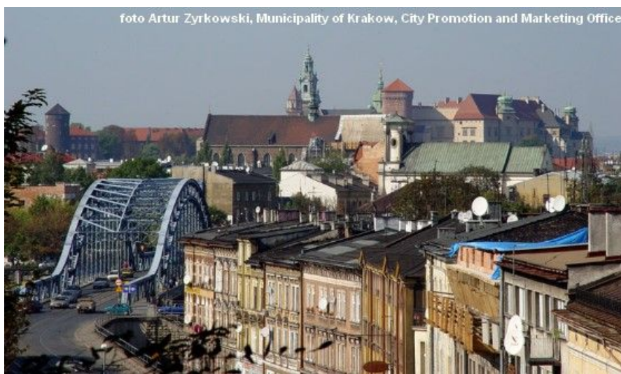
Utsikt over Krakow og Wawel Slott

Flyplassen er også kjent som John Paul II International Airport etter forrige pave, som studerte i Krakow, der han også var erkebiskop. På flyplassen finner du alt du trenger av informasjonskontor, bilutleie, minibank og vekslingskontor, stellerom, postkontor, spisesteder og butikker.