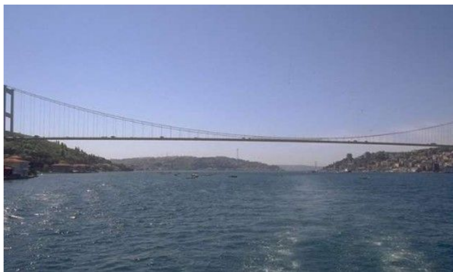
Bosporusbroen var verdens fjerde lengste hengebro da den åpnet i 1973. Her har du muligheten til å spasere fra Europa til Asia og tilbake igjen på én ettermiddag!

Ankommer du med fly, lander du på Atatürk flyplass, som ligger ca. 2,5 mil sørvest for Istanbul. Vær forberedt på å betale 20 euro eller ca 160 kroner for et 30-dagers visum ved ankomst. Taxi til gamlebyen koster rundt 90 kroner. Det går tog inn til bydelen Aksaray hvert tiende minutt. Turen koster bare fem kroner og tar en halv time. Fra Akseray er det lett å komme videre til Sultanahmet (gamlebyen) med trikk. Fire trikkestopp og fem kroner.