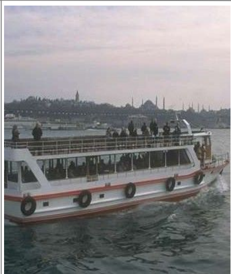
Fra havnen i bydelen Sirkeci går det stadig ferger ut til den idylliske lille øygruppen Princes' Islands, et svært yndet utfartssted for Istanbuls innbyggere.

Dette er Tyrkias fjerde største by. Bursa var det ottomanske rikets første hovedstad. Det er en grønn og velstelt by. Severdigheter er den berømte Grønne moské og Silkemarkedet. Besøk også et av byens badehus fra ottomantiden, bygd rundt en av Bursas naturlige kilder.