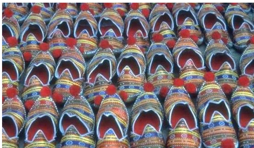
På verdens eldste shoppingssenter Grand Bazaar kan du finne alt mulig, også tøfler .

De aller fleste butikkene har åpent minst tolv timer daglig, fra kl. 0800 eller 0900 om morgenen til kl. 2000 eller 2100 om kvelden. Enkelte butikkeiere stenger en times tid på ettermiddagen for å be i moskeen.