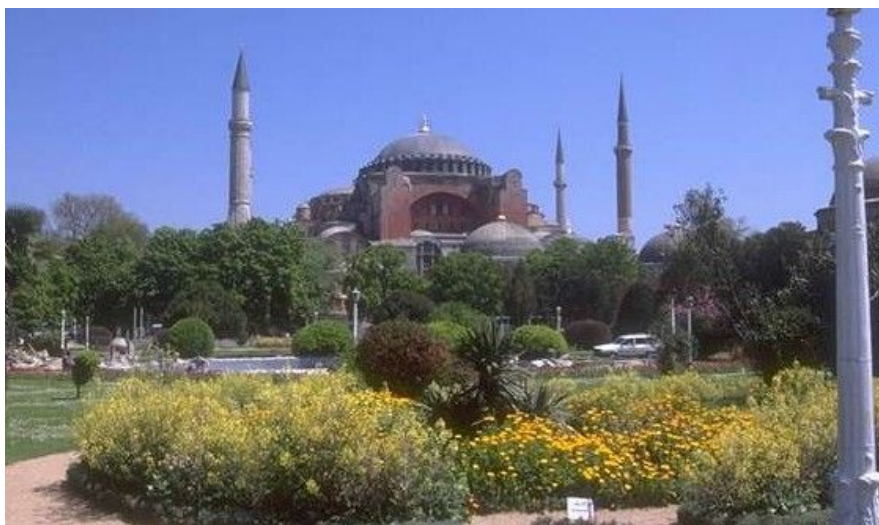
Istanbuls berømte Hagia Sofia ligger i gamlebyen Sultanahmet, og ble bygget rundt år 535. Den regnes som det ypperste av byzantinsk arkitektur, og var i århundrevis verdens største katedral.