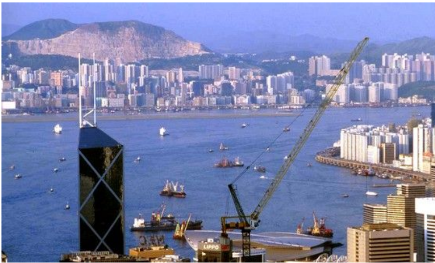
Hong Kong er kjent for sin spektakulære skyline. Den mørke skyskraperen til venstre er the Bank of China Tower, Hong Kongs 3. høyeste bygning.

Hong Kong International Airport ble åpnet i 1998 og ligger på en egen øy like vest for sentrum. Her finner du alt av nødvendige fasiliteter som informasjon, hotellbooking, minibank, bilutleie, butikker, hoteller og restauranter. Fra flyplassen går det hurtigtog inn til Kowloon eller Hong Kong Island Central hvert tiende minutt. Prisene ligger på ca. 80-100 kroner hver vei, og tar rundt 20 minutter. Det finnes også billigere busser til og fra flyplassen, men disse går sjeldnere og tar atskillig lengre tid.