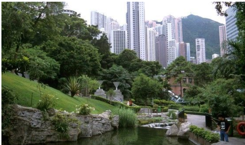
Hong Kong park med sine kunstige dammer og innsjøer, flotte hageanlegg og iøyenfallende omgivelser gjør spaserturen til et av de beste ferieminnene.

Det kan også være en god idé å sjekke i gratismagasinet Hong Kong Family Fun Guide, som du finner i shoppingssentre og på mange hoteller, for en oppdatert oversikt over hva som skjer av interesse for barnefamilier i Hong Kong.