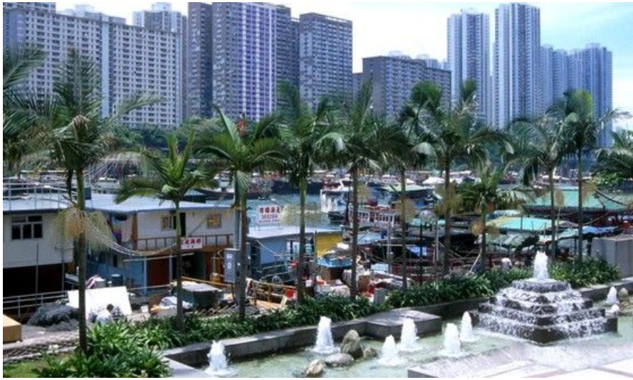
Ta gjerne en tur til bydelen Aberdeen med sine havnepromenader og sjøliv.

Hvis du fortsatt er motivert for å spasere videre, kan du gå nordvestover til du kommer til Ko Shing Street. Dette er Hong Kongs fremste gate for å handle helsekost, urter og kinesisk naturmedisin. Eller du kan fortsette rett nordover mot Macau-fergenes terminal. Her ligger det tidligere havnekontoret, som nå er Western Market, bygd i 1906 og erklært som historisk monument i 1988.