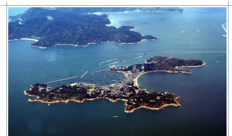
Hong Kong består av uttallige øyer, men Hong Kong Island er sammen med Lantau de store og dominerende. Her ser du Cheung Chau med Lantau bak.

Også Zhuhai, på den andre siden av sundet for Macau, er en spesiell økonomisk sone i Kina. Zhuhai er en grønn og velholdt universitetsby med rundt 500 000 innbyggere. Byen har ikke altfor mange attraksjoner for den tilfeldige turist, men New Yuan Ming Palace er vel verdt et besøk. Denne parken har gjenskapt attraksjoner og historiske steder fra både Kina og Europa, bl.a. den kinesiske mur. Du har også en eventyr-/badepark, the Lost City, innenfor portene.