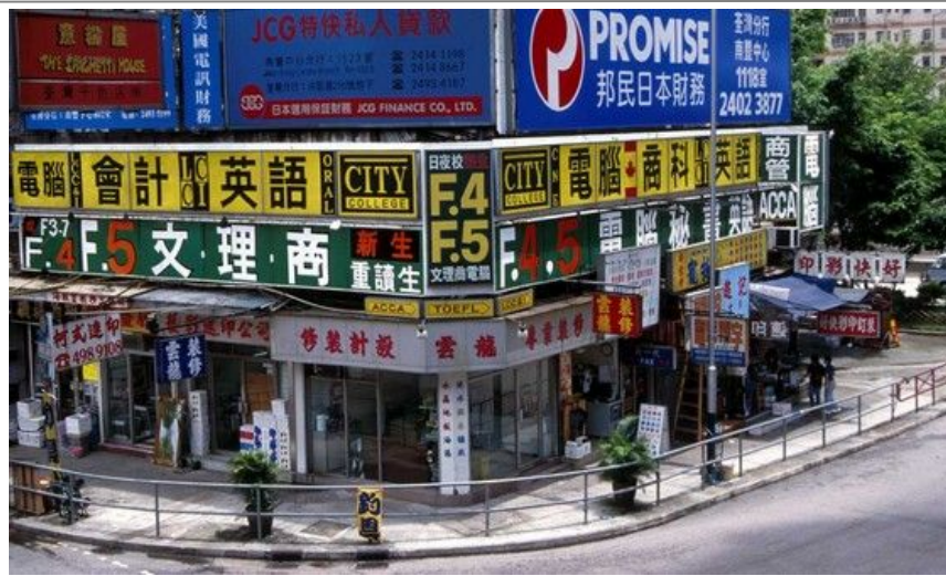
Shopping gjøres gjerne i bydelen Stanley og Stanley market i Hong Kong Island. Du finner selvfølgelig flere andre markedsområder i Hong Kong.

Hong Kong er blant Asias dyreste byer, men endel artikler kan du finne atskillig rimeligere enn i Europa. Silkevarer finner du nesten overalt. Det meste med påskriften Made In Hong Kong, som elektroniske artikler, gjør at du sparer transport- og importtillegget på tilsvarende varer i Europa. Steiner som jade er veldig populært og regnes som helsebringende i Kina, men sett deg godt inn i markedet først. Jadefigurene skal være helt grønne uten flekker eller merker. Hong Kong har for øvrig ingen skattlegging av salg, så det vil si at det er ikke noe å få refundert på flyplassen ved retur.