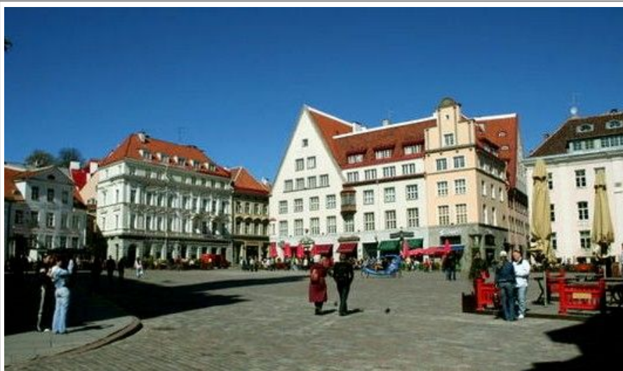
Man trenger ikke bil for å reise til Tallinn. Har du tid anbefaler vi en utflukt hit fra Helsinki.

Tallinn er mest kjent for sin middelalderbebyggelse, og hele det historiske sentrum er på UNESCOs liste over verneverdige steder.