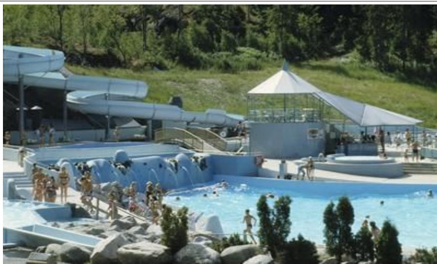
Serena Water Amusement Park er Nordens største badepark

På sommeren kan du ta barna med på et båtcruise. Disse turene starter på markedsplassen hver time fra 1000, og varer mellom halvannen og to timer. Herfra kan du også ta båt til utfluktsmålet Porvoo eller den idylliske småbyen Inkoo