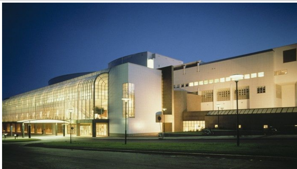
Finland og Helsinki er moderne og teknologisk. I hovedstaden finnes en rekke bygninger av høy arkitektonisk kvalitet, som dette Operahuset.

Men enkelte av de største attraksjonene når du ikke til fots. Den stjerneformede festningen Suomenlinna ligger på en øy utenfor sentrum, og har blitt et nasjonalsymbol. Den står på UNESCOs Verdensarvliste, og er et populært utfluktsted både for Helsinkis innbyggere og turister. Og på øya Korkeasaari ligger Helsinkis dyrehage.