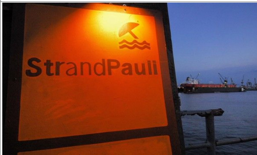
St. Pauli er arbeiderbydelen i Hamburg og byr på kneiper, red light district, en strand og hyggelige butikker

Området øst for stasjonen heter St.Georg , og her ligger mange rimelige hoteller, ølkneiper og barer.