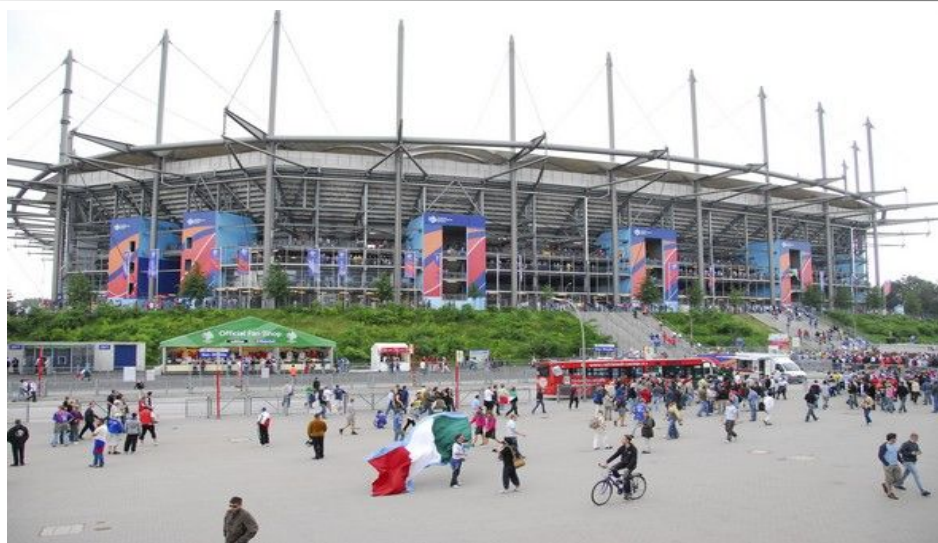
Gedigne AOL Arena er stedet hvor byens stolthet, fotballaget Hamburger SV spiller sine hjemmekamper

Det går vanlige rutebuss til sentrum som kun koster cirka 20 kroner, men disse tar lang tid og stopper på alle holdeplasser. Airport Express-bussene går derimot raskt inn til Hauptbahnhof, beregn ca 25 minutter, og det koster deg 40 kroner. I løpet av 2008/09 skal et nytt flytog ha avganger hvert 10. minutt.