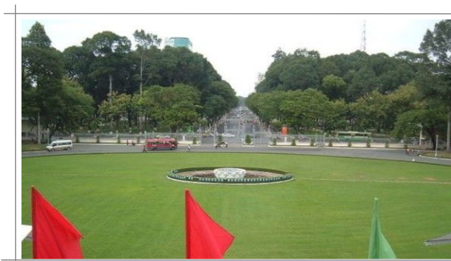
Bildet er tatt fra toppen av det gamle presidentpalasset i Ho Chi Minh City, nå kalt Reunification Palace, ned mot porten hvor nordvietnamesiske tanks kom igjennom i april 1975.

Det skal ikke legges skjul på at vietnameserne spiser absolutt alt som kan krype, fly, svømme eller gå. Hunder, katter, gresshopper, slanger, mus, krokodiller eller apekatter – alt går ned på høykant. De aller fleste av oss blir vel ikke spesielt fristet, men du kan føle deg forholdsvis trygg på at innenfor Ho Chi Minh Citys grenser, på en restaurant med menyen på engelsk, er det minimal sjanse for uforvarende å sette Fido eller Pusur i halsen.