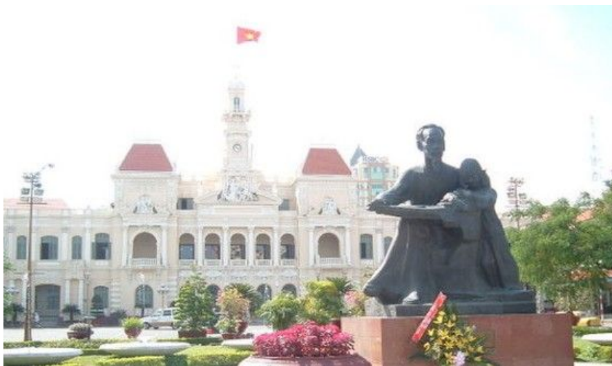
Byens rådhus ble bygd tidlig på 1900-tallet, og i den lille parken foran står en statue av Onkel Ho, selveste Ho Chi Minh. Her står antakelig også et tjuetalls turister oppstilt for å bli fotografert foran statuen.

Det åpner etter lunsj kl. 1330, og hvis du er interessert i historien bak byen du nå besøker, er det vel verdt å bruke en time eller to her. Spesielt inntrykk gjør det verdenskjente fotoet av munken Thich Quang Duc, som satte fyr på seg selv og brant i hjel i protest mot president Diems politikk.