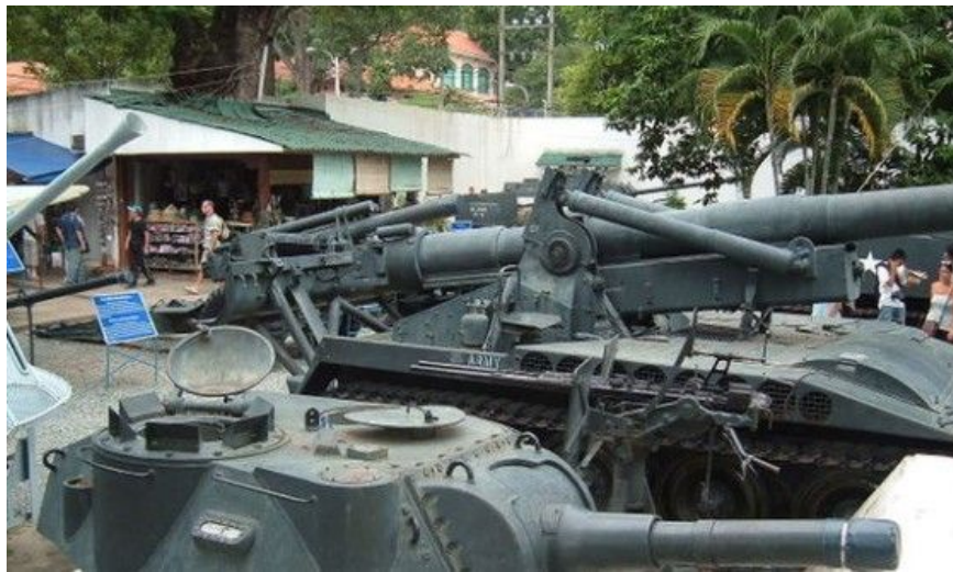
Krigsmuseet (War Remnants Museum) i Ho Chi Minh City. I hagen utenfor er det stilt ut amerikanske jagerfly, kanoner, tanks og bulldosere, som ble brukt til å ødelegge landets rismarker og infrastruktur.

Tunnelene bestod av kilometerlange ganger (250 km bare i Cuchi) som flettet sammen underjordiske "byer" der det var skoler, kjøkken, teatre, sykestuer og oppbevaring av mat og våpen. Opptil 10 000 mennesker levde her nede i flere år og var bare oppe om natten for å stelle avlingene sine. Disse tunnelene gjorde det også mulig for "Charlie" (amerikanernes kallenavn på nordvietnameserne) å snike seg usett inn på de amerikanske og sørvietnamesiske styrkene. Tunnelsystemet var en medvirkende faktor til at nordvietnameserne omsider vant borgerkrigen i 1975.