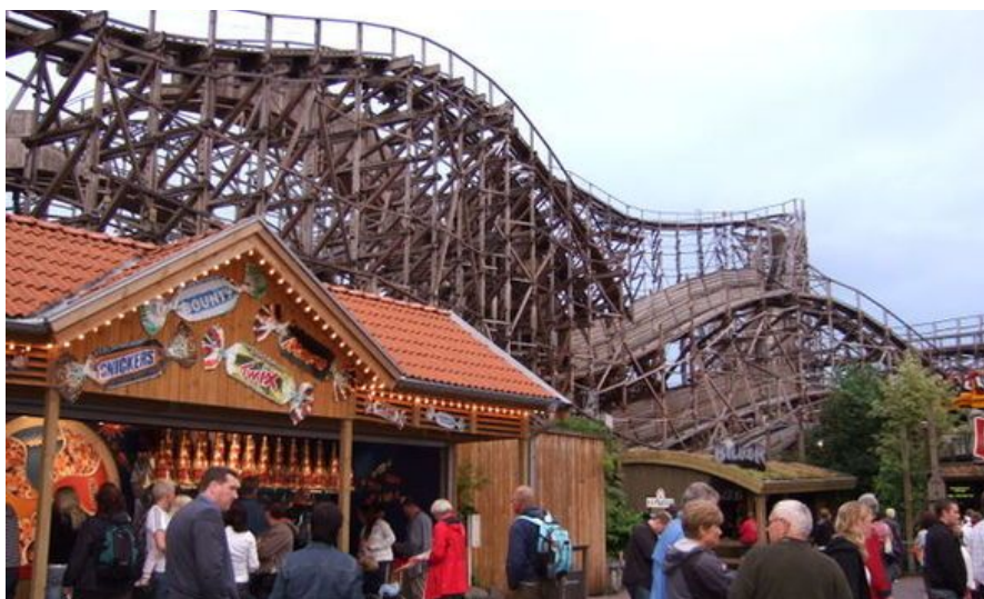
Liseberg, Nordens største fornøylespark med et utall av attraksjoner er nok førstevalget til alle barn når man besøker Gøteborg.

I Backaplan, nord for Götaelven, finner du Lekobus , Europas største innendørs lekeland på over 5000 kvadratmeter. Her er det blant annet skøytebane, rutsjebaner, klatrevegger, hoppeslott, ballsjø, babyhjørne og iskremfabrikk hvor barna kan lage sin egen is. Åpent hver dag fra 1000 til 2000. Prisen er 100 kroner for tre timers bruk av alle aktiviteter, voksne i følge med barn går gratis.