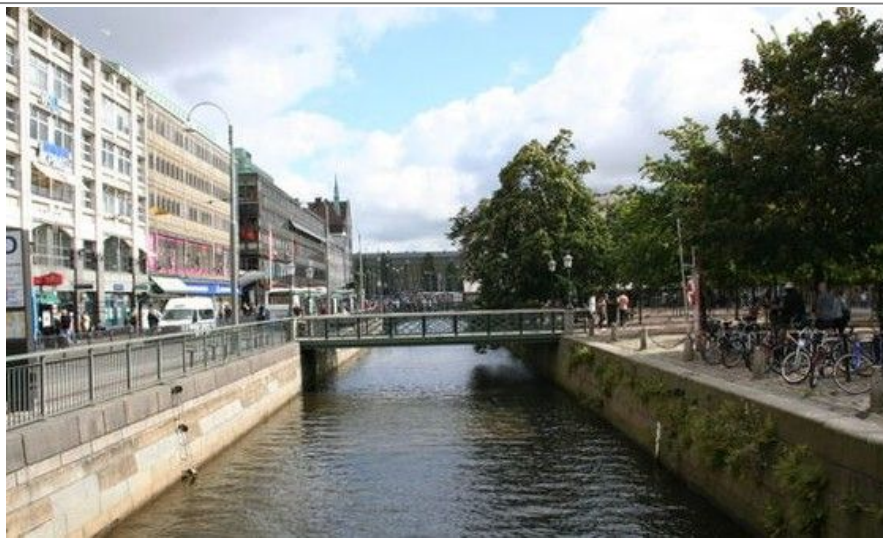
Ved Stora Hamnkanalen i sentrum ligger Brunnsparken, et populært møtested i Göteborg.

I enden av Östra Hamngatan ligger Kungsportplatsen, hvor du kommer til nok en kanal, Vallgraven. Krysser du broen, fortsetter paradegaten kungsportsavenyn rett frem. Du har nå Stora teatern og Kungsparken på din høyre side og den flotte parken Trädgårdsföreningen til venstre.