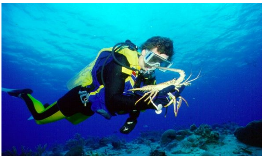
Havet utenfor Fort Lauderdale er utmerket for dykking og snorkling.

Alle større hoteller i Fort Lauderdale har egne tennisbaner. Er du spesielt interessert, finnes det dessuten flere tennisklubber der du får leid både bane og coach.