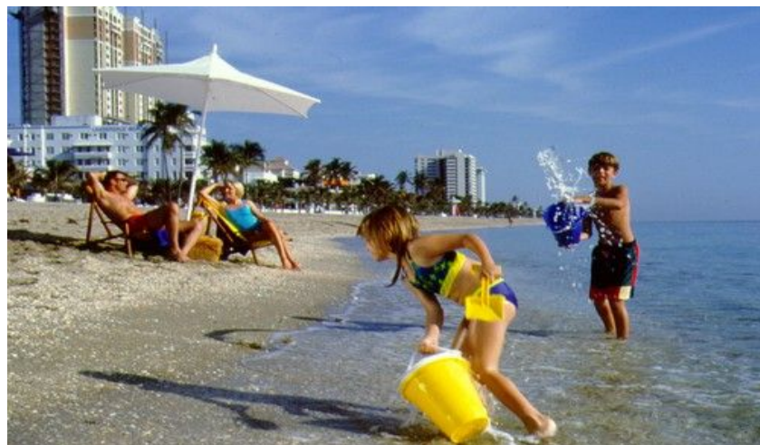
Den lange stranden er en av grunnene til at barn og ungdom elsker Fort Lauderdale.

På Boomers , sentralt i Fort Lauderdale, kan du leie gocart og bumpercars. Ønsker dere fornøylesparker, er Dania Beach Hurricane verdt et besøk. Her er Floridas største berg-og-dalbane i tre, en skikkelig adrenalinkick.