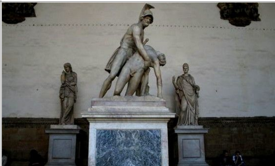
Firenze er full av kunst og ved Piazza della Signoria finner du mange flotte statuer.