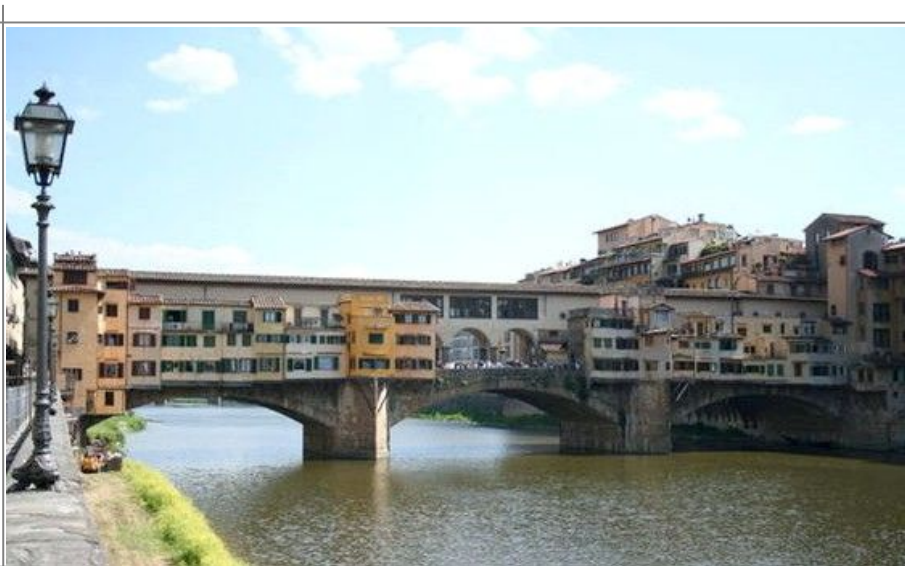
I nærheten av flotte Ponte Vecchia finner du flere bra hoteller

Firenze har naturligvis også luksushoteller, som er blant de beste i Europa. Prisnivået generelt er ganske høyt til å være i Italia, men så er også Toscana-området en av de regionene i Europa med høyest levestandard. Prisnivået på hoteller er ganske likt det norske.