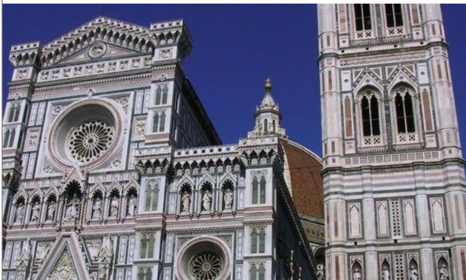
Plassen rundt Duomo og klokketårnet er ofte det første stedet for turister i Firenze.

Det er heller ikke noe problem å fly til Pisa og ta tog til Firenze. Norwegian har fly dit. Er det vanskelig å få flybilletter til Firenze eller Pisa, kan også Roma være et alternativ. Det tar mindre enn tre timer med tog fra Roma til Firenze.