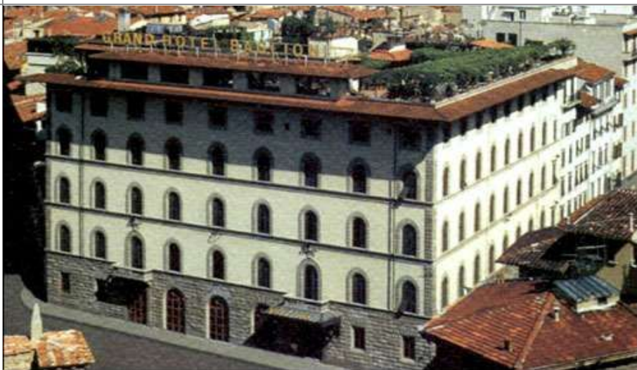
5 stjerner hotellet Grand hotel Florence er nær Duomo og meget eksklusivt.