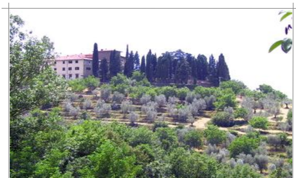
Toscana byr på mange flotte steder for deg som har leiebil tilgjengelig

Siden Pisa bare ligger ca. 80 kilometer fra Firenze, klarer du fint å få med deg det skjeve tårnet og alt annet Pisa har å tilby av severdigheter på en dagstur dit. Pisa ligger dessuten ved havet, og byturen kan med hell kombineres med litt bading i Middelhavet.