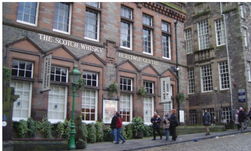
Scotch Whisky Heritage Centre tar for seg alt som har med skotsk whisky å gjøre.

Kapellet er oppkalt etter kong Malcolm IIIs helgenerklærte kone, og Malcolm selv vil for evig bli husket som inspirasjonen bak Macbeth. Legg merke til den digre kanonen som står utenfor kapellet. Den kalles Mons Meg og er fra 1449.