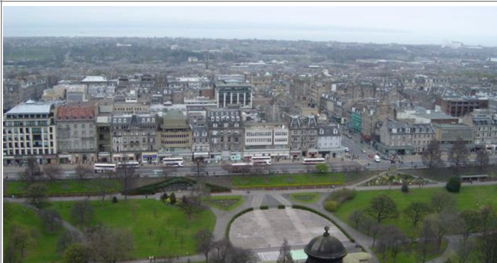
Utsikt over byen fra Edinburgh Castle

Sekkepipen er ved siden av kilten det mest erketyptisk skotske man kan tenke seg, selv om irene også bruker sekkepipe, og de gamle romerne hadde sin variant av instrumentet. Men igjen, en ekte og god sekkepipe vil koste titusener av kroner, og siden du neppe kommer til å bruke den mye, kan du like gjerne gå for en billigere kopi som ser like bra ut når den henger på veggen.