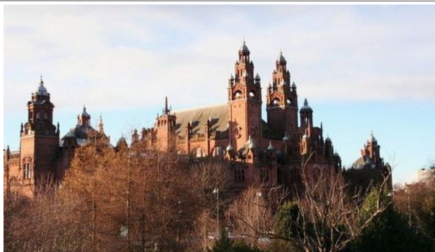
Skottlands største by Glasgow ligger ca 74 km fra Edinburgh

Glasgow er Skottlands største by og har mye å tilby alle turister. Skottene sier selv at Edinburgh er kjent for sin skjønnhet, mens Glasgow er kjent for sin vennlighet og sjarm. Er du interessert i shopping, kunst og kultur, god mat og drikke, golf eller fotball, arkitektur og uteliv er dette byen for deg.