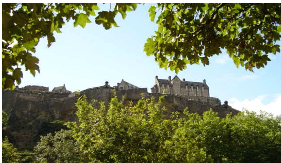
Edinburgh Castle sett fra parken Princes Street Gardens.

Et tredje alternativ er å fly til den ene byen og hjem fra den andre, og dermed få sett begge Skottlands storbyer på samme tur.