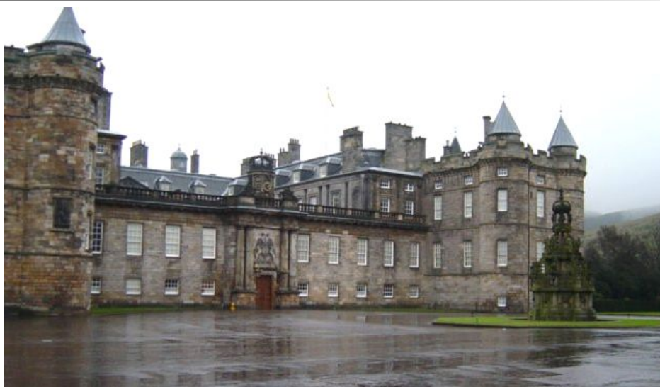
Den gamle kongeresidensen Palace of Holyroodhouse fra hovedinngangen

Edinburgs fremste shoppinggate ligger på nordsiden av Princes Street Gardens og heter naturlig nok Princes Street. Den er halvannen kilometer lang og har ikke bygninger på sørsiden, men fin utsikt mot parken, gamlebyen og slottet. Parallellgaten ovenfor Princes Street er George Street, en gate konstruert for å være New Towns hovedgate. På hver ende av gaten ligger et elegant torg, Charlotte Square i vest og St Andrews Square i øst.