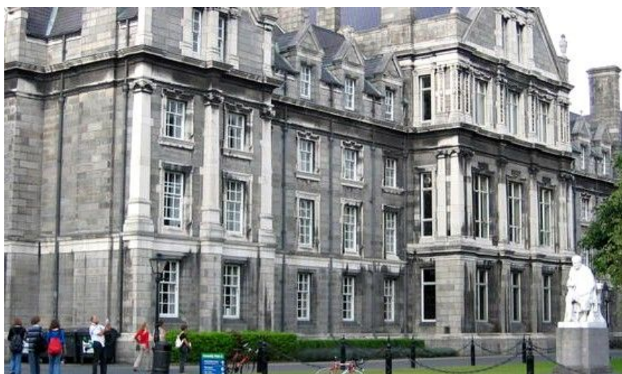
Trinity College er Irlands eldste og mest prestisjetunge college og ble grunnlagt i 1592.

Når du er tilbake ved Dublin Castle igjen, begynner du sikkert å bli klar for lunsj. Gå nordover mot Liffey opp Parliament Street, og du vil snart se puben Turk's Head på din venstre side. Her serveres et bredt utvalg av småretter til lunsj, som sandwicher, kyllingvinger eller salater. Etterpå kan du fortsette østover inn i Temple Bar og bruke resten av ettermiddagen på å rusle rundt i dette som er turistenes favorittbydel. Her finner du hundrevis av gallerier og museer, puber og restauranter, suvenirboder og fasjonable butikker som kan holde deg opptatt i timevis.