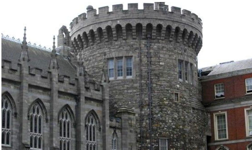
Dublin Castle er fra så tidlig som 1200-tallet og har hatt en viktig rolle i Dublins historie.

Irlands eldste og mest prestisjetunge college ble grunnlagt i 1592. Det er mest kjent for å huse den verdensberømte Book of Kells. Dette er en av verdens eldste bevarte bøker, skrevet rundt år 800 med evangeliene fra Det nye testamente, vakkert og intrikat dekorert. Utenfor vil du sikkert få tilbud fra en av studentene om en guidet omvisning. Åpent daglig fra kl. 0930 til 1700 mandag til lørdag, kl. 1200 til 1630 på søndager. Inngang rundt 65 kroner, gratis for barn under 12 år.