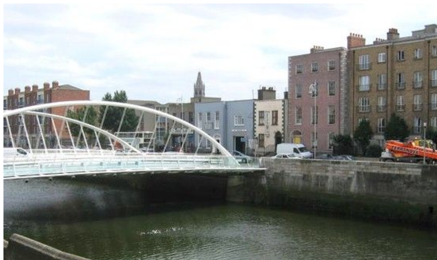
Elven Liffey er en forholdsvis smal, grunn og brungrønn elv som deler Dublin i to.

Det finnes også to flybusselskaper. En flybussbillett koster rundt 40 kroner, og bussene går hvert 15. minutt. På flyplassen finner du alt du måtte ha behov for av turistinformasjon, leiebilselskaper, hotellbooking, minibanker og restauranter.