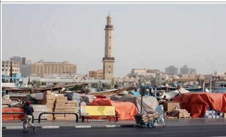
Grand Mosque i bakgrunnen sett fra havnen like ved gullsouken

I The Creek, ikke langt fra Bur Dubai, finner du Sheikh Saeed Al Maktoum House, en imponerende bygning fra 1896. Det var opprinnelig residensen til makthaverne. I dag er dette et museum.