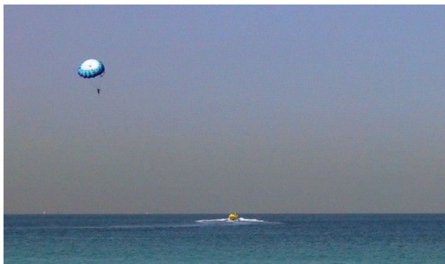
Vannsportaktiviteter er ypperlig i Dubai. Hotellet ordner ofte aktiviteter for deg.

I og med at Dubai ligger ved golfen, er det ikke overraskende at byen tilbyr en rekke aktiviteter for vannsport. Du kan leie jetski, vannski eller dykkerutstyr.