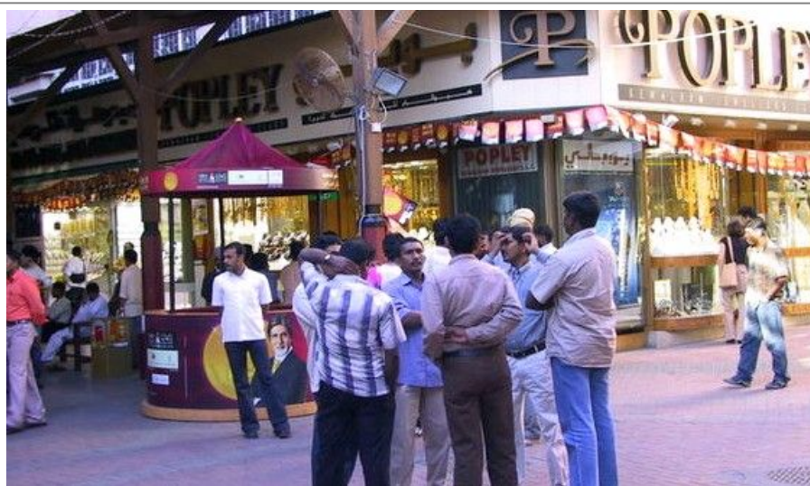
Dubais innbyggere er vennlige og du møter store grupper menn, og kvinner med mange barn.

Dubai er i realiteten to separate byer, delt av elven Khor Dubai. Nord for elven finner du Deira, og sør for elven finner du Bur Dubai. Begge bydelene er fulle av tradisjonell arkitektur og fantastiske nybygg. Byens egentlige sentrum finner du i Deira.