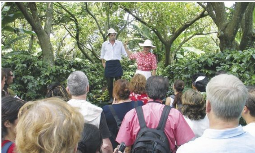
Capuccino Coffee Tour, Central Valley.

Det er ofte et svært godt utvalg i juice fra tropiske frukter som det kan bli lenge til neste gang du får muligheten til å drikke i nypresset form, så ta for deg! Pasjonsfrukt, mango, papaya, ananas og guava er bare noen av de velsmakende og friske variantene som venter.