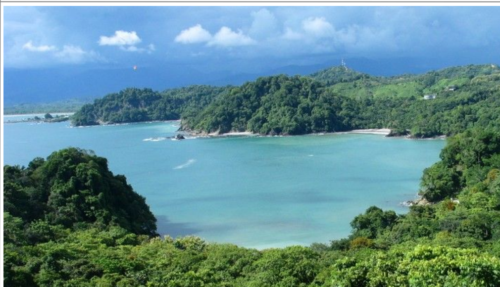
Costa Rica er kjent for sin svært vakre natur og et yrende dyreliv

Hovedattraksjonen er den ekstremt varierte naturen og floraen, og det yrende dyrelivet. Nasjonalparken Tortuguero som ligger nord på den karibiske kysten, er den viktigste yngleplassen for de svære grønne havskilpaddene, som i juli-oktober kommer inn fra havet i hopetall, graver en dyp grop i sandstranda, legger dusinvis av egg og svømmer ut igjen.