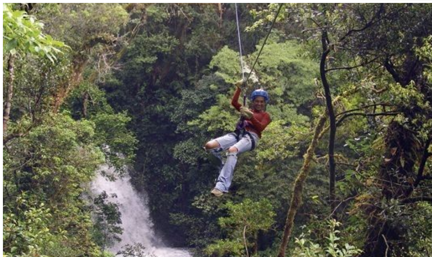
Canopy Adventure San Jose de la Montaña

Du kan naturligvis velge om du vil kjøpe pakker for en enkelt utflukt eller større programmer som dekker flere destinasjoner med måltider og overnattinger.