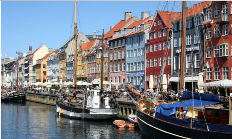
Nyhavn er ofte det første stedet for turister i København.

Kastrup har også buss-holdeplass. Dette er først og fremst for deg som skal andre steder enn København, f.eks. til Sverige.