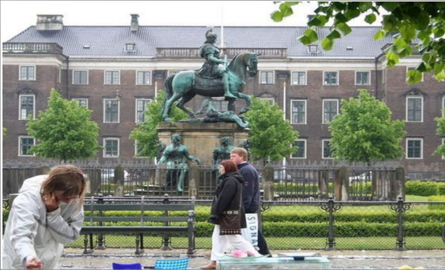
Kongens Nytorv og nærområdet byr på mange attraksjoner og også markeder

Gå nå Købmagergade nedover mot Strøget igjen. Du vil da komme rett på Amagertorv. Her er som regel folkelivet på sitt mest intense med gateartister og handleglade mennesker ut og inn av rekken med butikker og varemagasiner.