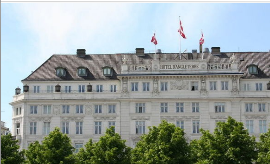
250 år gamle Hotel d'Angleterre er et av Københavns beste hoteller (og dyreste)