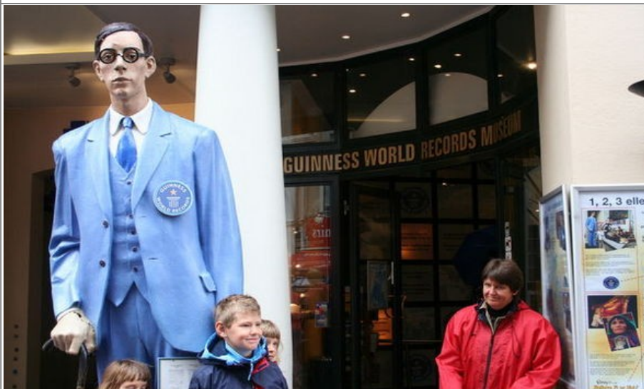
Guinness World of Records og verdens høyeste mann er et landemerke på Strøget

Alternativt skal du satse på museet til Guinness World of Records. Utenfor museet blir du hilst velkommen av verdens høyeste mann. Innenfor finner du informasjon, modeller og dukker som viser alle mulige slags verdensrekorder. Adressen er Østergade 16, rett ved Strøget. På samme adresse finner du huset som kalles The Mystic Exploratorie, som har en rekke spennende interaktive demonstrasjoner og utstillinger. Du kan for eksempel bestemme over været, «prøve» en elektrisk stol eller møte Frankenstein.