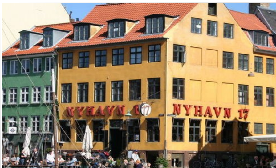
Det finnes mange koselige hoteller i og ved Nyhavn i København

Dette hotellet ligger perfekt til på Rådhuspladsen midt i byen. Hotellet har 192 rom og får mye skryt for god service. Vær oppmerksom på at det kan komme støy fra en nattklubb ved hotellet, men som sagt, bedre beliggenhet skal du lete lenge etter. Adressen er Rådhuspladsen 24.