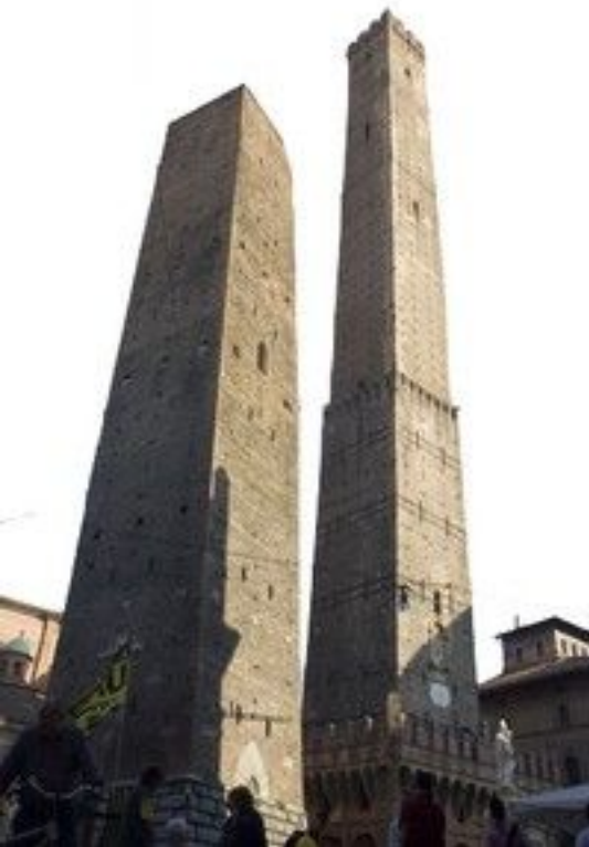
Det er ikke bare Pisa som har skjeve tårn. Disse to tårnene, oppkalt etter familiene Garisenda og Asinelli, ble bygget på 1100-tallet som en konkurranse.

Bologna har flere velholdte offentlige toaletter, men hvis en krise skulle oppstå, er det oftest heller ikke noe problem å stikke innom nærmeste hotell eller restaurant og spørre om lov til å benytte deres fasiliteter.