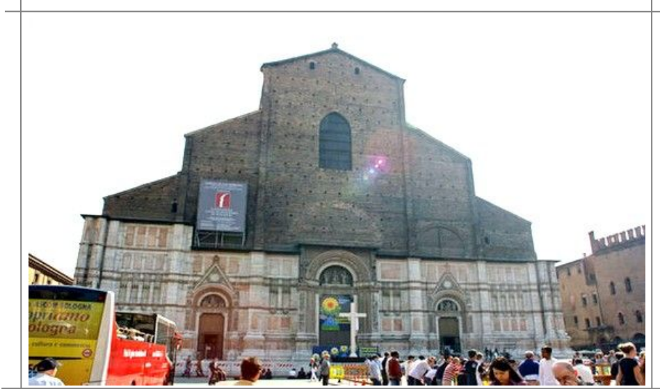
Den enorme, men uferdige kirken Basilica di San Petronio ble påbegynt i 1392, og er verdens femte største kirke.

Nord for Piazza Maggiore starter gjennomfartsårene og handlegatene Via Ugo Bassi og Via Rizzoli. Sving østover inn i Via Rizzoli, og du vil ikke kunne unngå å se neste severdighet noen hundre meter lenger frem. De fremste symbolene på Bologna er utvilsomt De to tårn, som ble bygd av to konkurrerende familier tidlig på 1100-tallet. Det laveste, Garisendatårnet, er 48 meter høyt og luter seg ca 3 meter til siden, og er dermed ikke åpent for publikum.