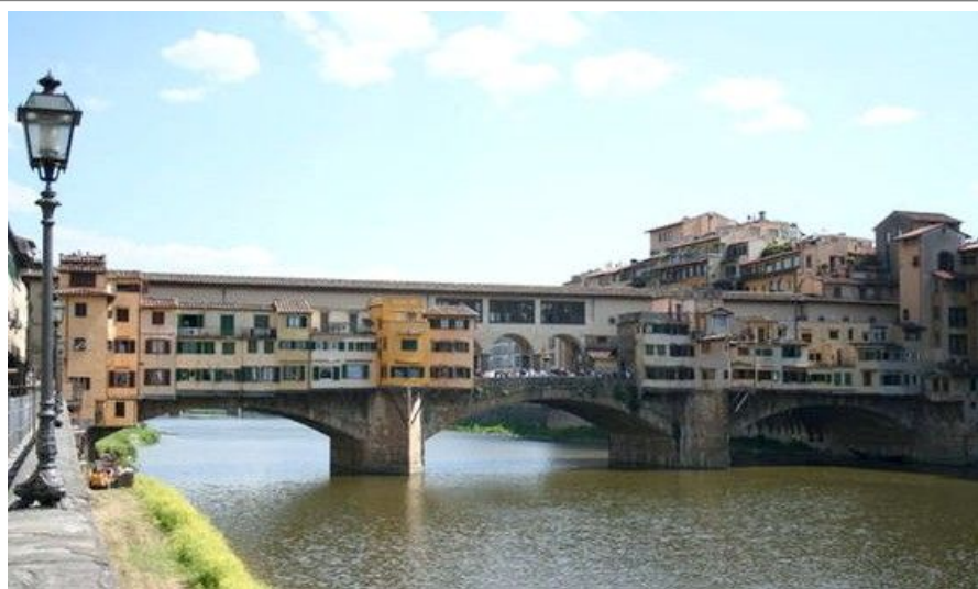
Firenze med sin berømte bro, Ponte Vecchio ligger mindre enn 100 kilometer fra Bologna.

Firenze er den største perlen i Toscana og renessansens sanne skattkammer. Firenze er en liten by som ikke skremmer deg som reisende, men samtidig er Firenze utrolig stor når det gjelder antall attraksjoner og opplevelser. Her står Michelangelos David-statue, og her finner du den berømte broen Ponte Vecchio. Har du ikke bil tilgjengelig, går det tog mellom Bologna og Firenze ca. hvert tjuende minutt, disse tar ca en time hver vei.