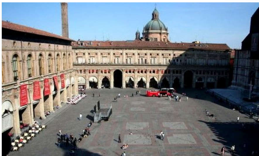
Utsikten fra vinduene i Palazzo Comunale og ned mot Bolognas ubestridte hjerte, Piazza Maggiore, som gjennom århundredene har huset både markeder og ridderturneringer.

Vil du smake på Bolognas sydende uteliv etterpå, ligger Via Zamboni i universitetsområdet bare noen meter nord for tårnene. Her ligger nok av puber, barer og klubber, selv om disse sjelden blir fylt opp før nærmere kl. 0100 i helgene av gjester som holder det gående til dagen gryr.