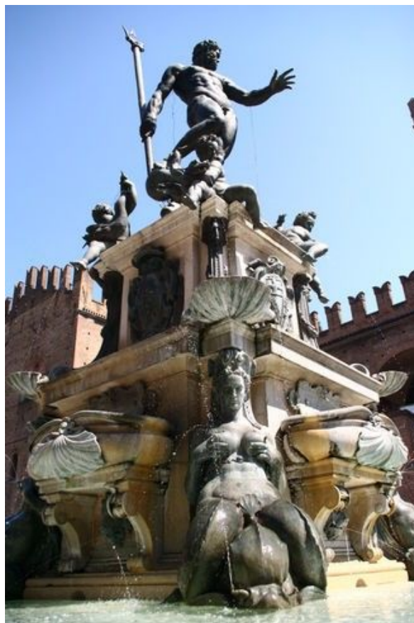
Neptunfontenen fra 1565, med engler og sirener som spruter vann fra brystvortene.

På den tilstøtende Piazza del Nettuno står et annet av Bolognas symboler, den grandiose Neptunfontenen fra 1565, med engler og sirener som spruter vann fra brystvortene.