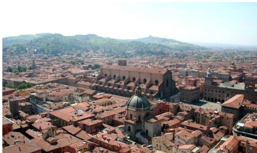
Utsikten fra toppen av det 98 meter høye Asinellitårnet mot Piazza Maggiore og Basilica di San Petronio.

Hvis du ankommer med fly, lander du på Bolognas internasjonale flyplass, oppkalt etter byens store sønn, nobelprisvinneren og vitenskapsmannen Guglielmo Marconi. Flyplassen ligger 6 kilometer nordvest for sentrum, som kan nås på 20 minutter med buss til en pris av rundt 40 kroner. Flyplassen er Italias tredje viktigste, grunnet den sentrale beliggenheten i landet, og har alle moderne fasiliteter du kan ha bruk for. En taxi vil normalt koste deg rundt 120 kroner.