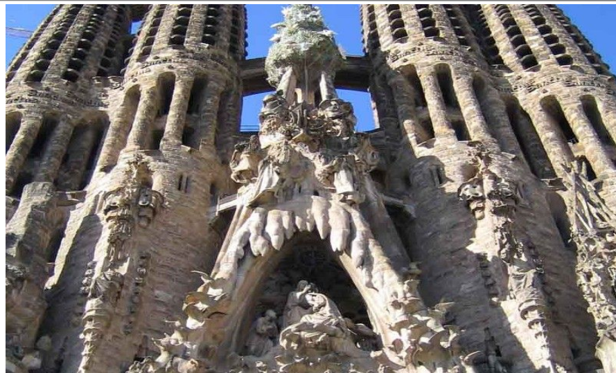
Sagrada Família er den største attraksjonen i Barcelona og fremstår som selve symbolet på byen.