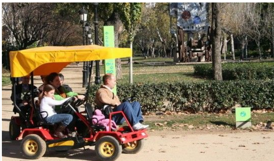
Barcelona har mange spennende attraksjoner for barn.

Tibidabo er en fornøylespark som ligger 30 minutter fra Placa de Catalunya. Det går egne busser direkte til parken med avgang fra varemagasinet El Corte Ingles, ved Placa de Catalunya. Parken ligger på Barcelonas høyeste punkt og har flott utsikt over byen. Det er et mangfold av tilbud for både voksne og barn her.