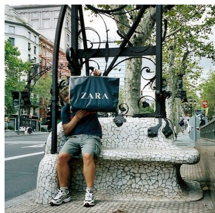
Det er gøy å shoppe i Barcelona

Langs La Rambla ligger turistfellene. Men øverst i La Rambla, ved plassen Placa de Catalunya, finner du Barcelonas største, El Corte Ingles. Det er det mest kjente varemagasinet i Spania. Her finner du alle typer varer, blant annet klær og sko. Salget starter tidlig i januar og tidlig juli. Ved Placa de Catalunya ligger også FNAC, som har alt av bøker i tillegg til mye musikk og film.