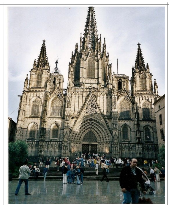
Catedral de la Seu

Eixample var det første området som ble bygd utenfor bymurene. Her finner du færre av de små, sjarmerende gatene, og et mer moderne bybilde med kvartaler og snorrette gater. Eixample ligger vest for Barri Gotic. Siden bydelen er såpass ny, er det mange spektakulære bygninger her, blant annet La Pedrera, som på folkemunne kalles Mila-huset. Dette er et av Gaudis mest kjente byggverk. Du finner det langs gaten Passeig De Gracia. Området har flere gode hoteller, og etter et besøk i sentrum av Barcelona kan det være hyggelig med et parkbesøk i Eixample. Parc Joan Miró byr på gangstier, sportsanlegg og kunst. Parken ligger nordvest i byen ved gatene Carrer d'Arago og Carrer de Tarragona.