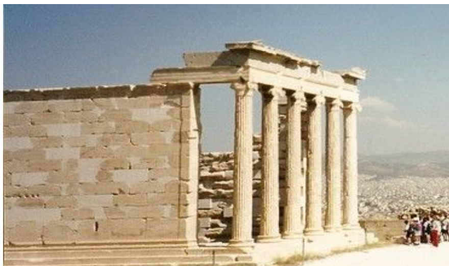
Parthenon, bygget 500 f.Kr til ære for gudinnen Athene, som byen er oppkalt etter..

Attica Zoologiske Hage er den største dyrehagen i Athen. Dette er en ny og privateid dyrehage som åpnet i mai 2000. Attica prøver å lage et godt hjem for dyrene, uten bur. Dyrehagen beskytter truede arter, som hvite løver og snøleoparder. Parken har åpent hver dag hele året fra 09:00 til solnedgang, og inngangsbillettene koster 95 kroner for voksne, og 75 for barn mellom 3 og 12 år. Attica ligger ved At Yalou i Spata.