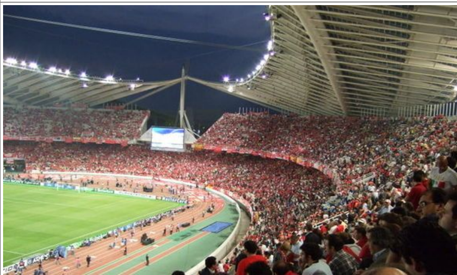
71000-seteren Olympic Stadion. Bildet er fra Champions League-finalen i 2007 hvor AC Milan vant over Liverpool FC.

Golf har ingen store tradisjoner i Hellas, og det finnes ikke mange gode baner i landet. Men populariteten har vokst de siste årene. Like utenfor Aten, i forstaden Glyfada ligger Glyfada Golf Course , en 18-hulls bane med par 73 som huset World Cup i 1979. Green fee på rundt 410 kroner.